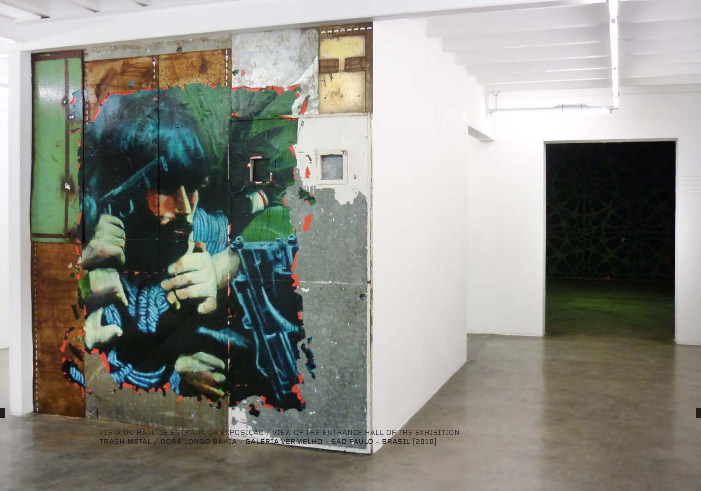
VISTA DO HALL DE ENTRADA DA EXPOSIÇÃO / VIEW OF THE ENTRANCE HALL OF THE EXHIBITION TRASH METAL / DORA LONGO BAHIA - GALERIA VERMELHO - SÃO PAULO - BRASIL [2010]