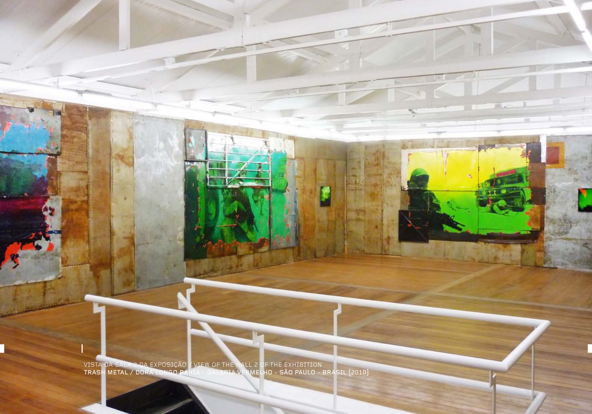
VISTA DA SALA 2 DA EXPOSIÇÃO / VIEW OF THE HALL 2 OF THE EXHIBITION TRASH METAL / DORA LONGO BAHIA - GALERIA VERMELHO - SÃO PAULO - BRASIL [2010]