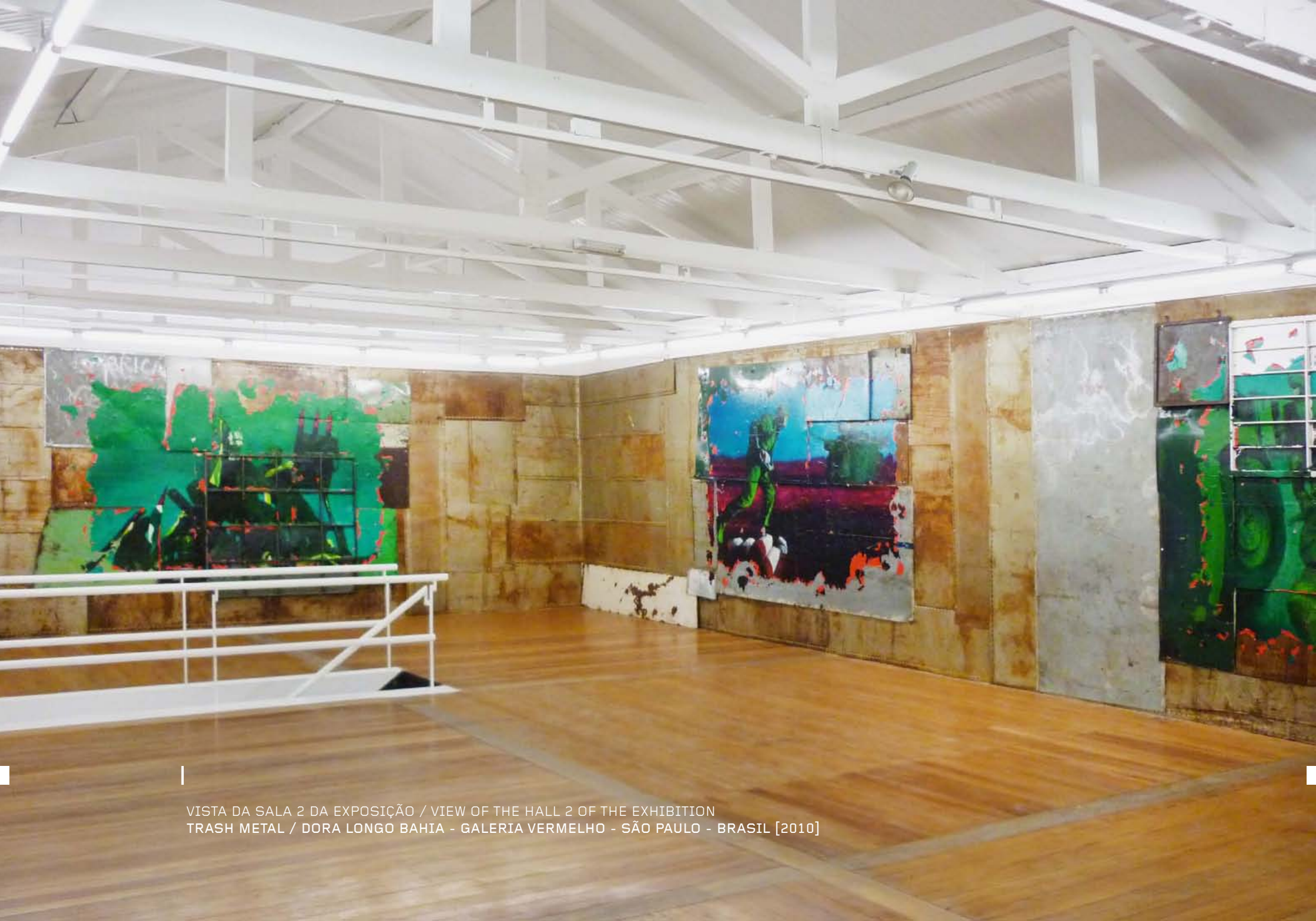
VISTA DA SALA 2 DA EXPOSIÇÃO / VIEW OF THE HALL 2 OF THE EXHIBITION TRASH METAL / DORA LONGO BAHIA - GALERIA VERMELHO - SÃO PAULO - BRASIL [2010]