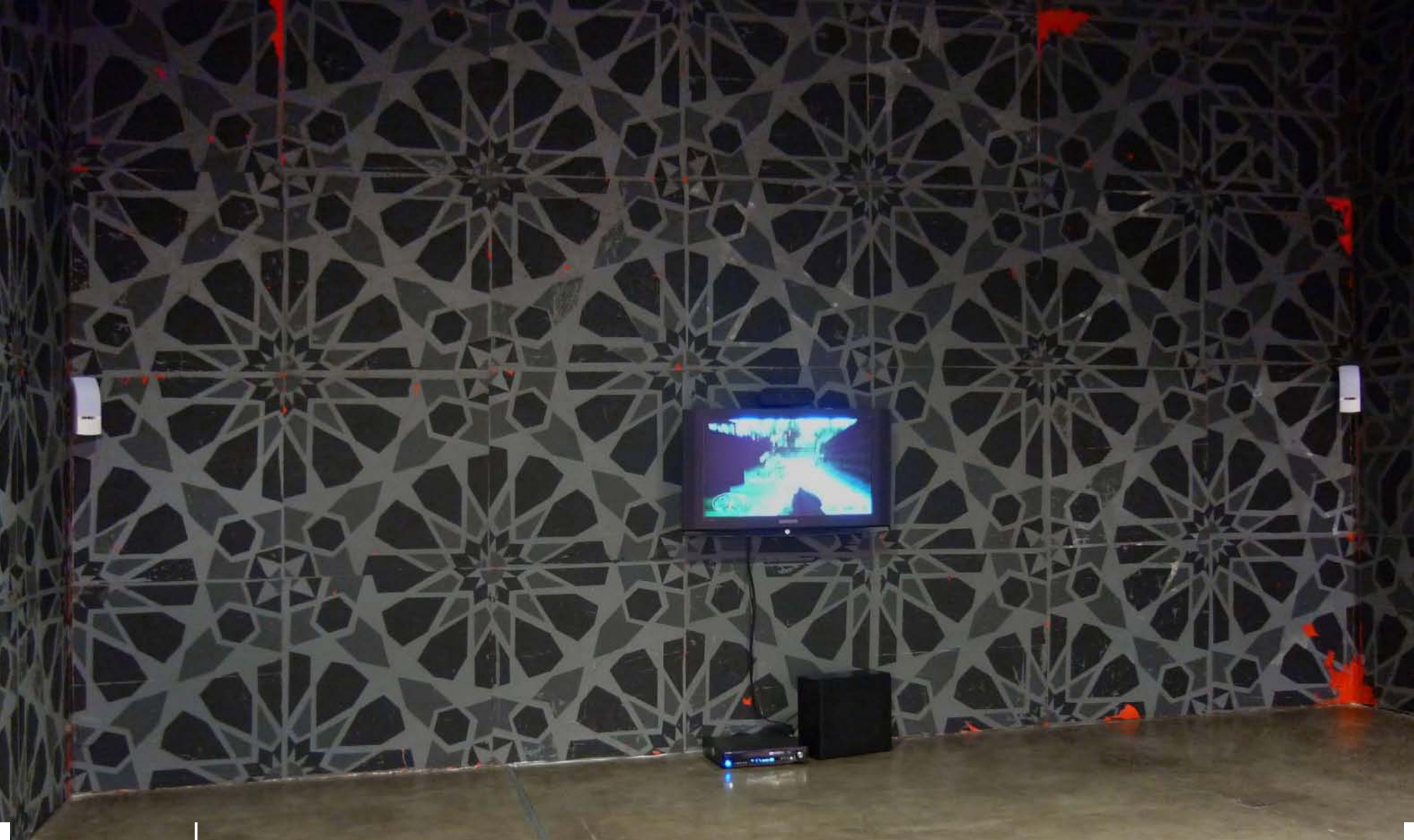
VISTA DA SALA 1 DA EXPOSIÇÃO / VIEW OF THE HALL 1 OF THE EXHIBITION TRASH METAL / DORA LONGO BAHIA - GALERIA VERMELHO - SÃO PAULO - BRASIL [2010]