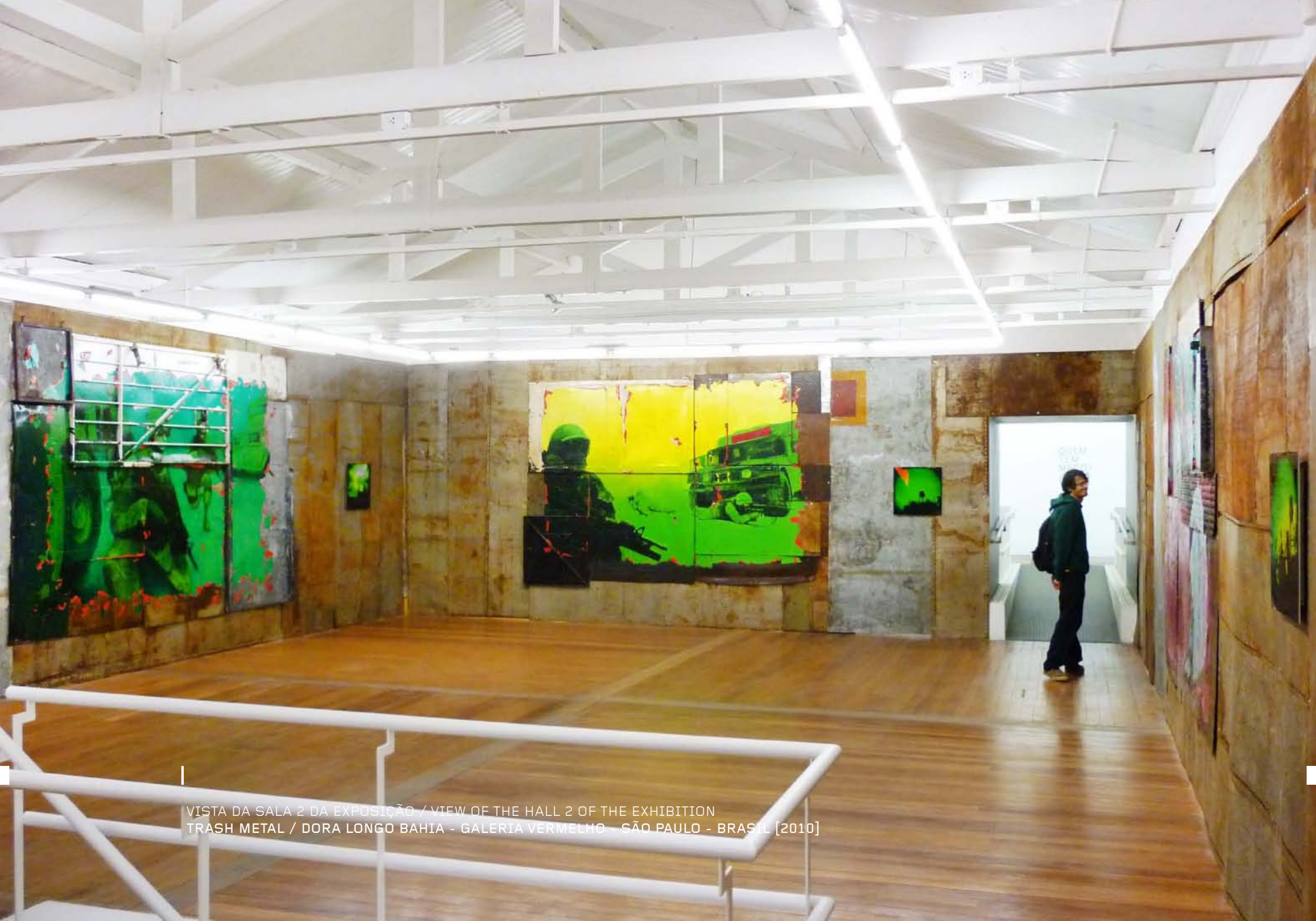
VISTA DA SALA 2 DA EXPOSIÇÃO / VIEW OF THE HALL 2 OF THE EXHIBITION TRASH METAL / DORA LONGO BAHIA - GALERIA VERMELHO - SÃO PAULO - BRASIL [2010]