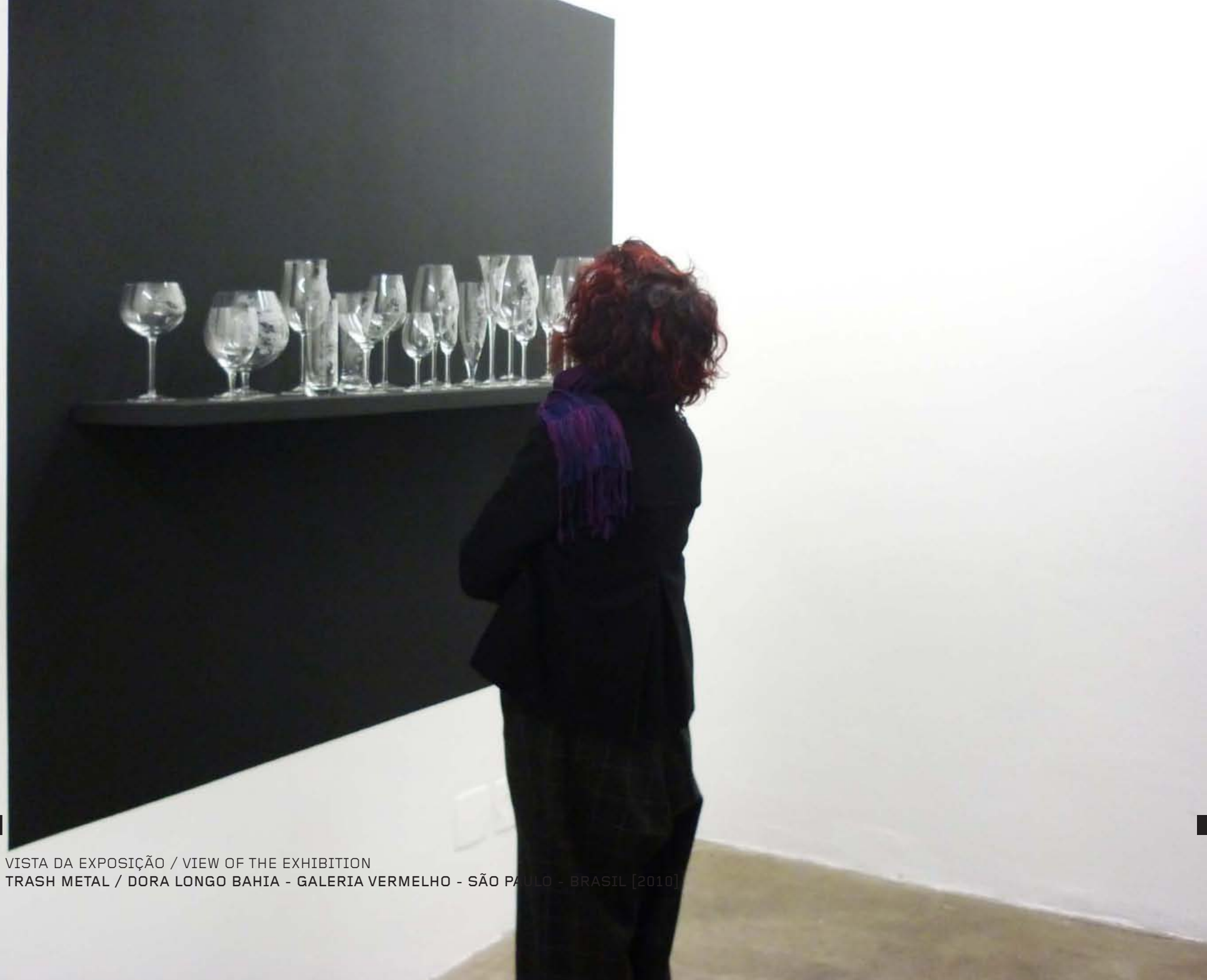
VISTA DA EXPOSIÇÃO / VIEW OF THE EXHIBITION TRASH METAL / DORA LONGO BAHIA - GALERIA VERMELHO - SÃO PAULO - BRASIL [2010]