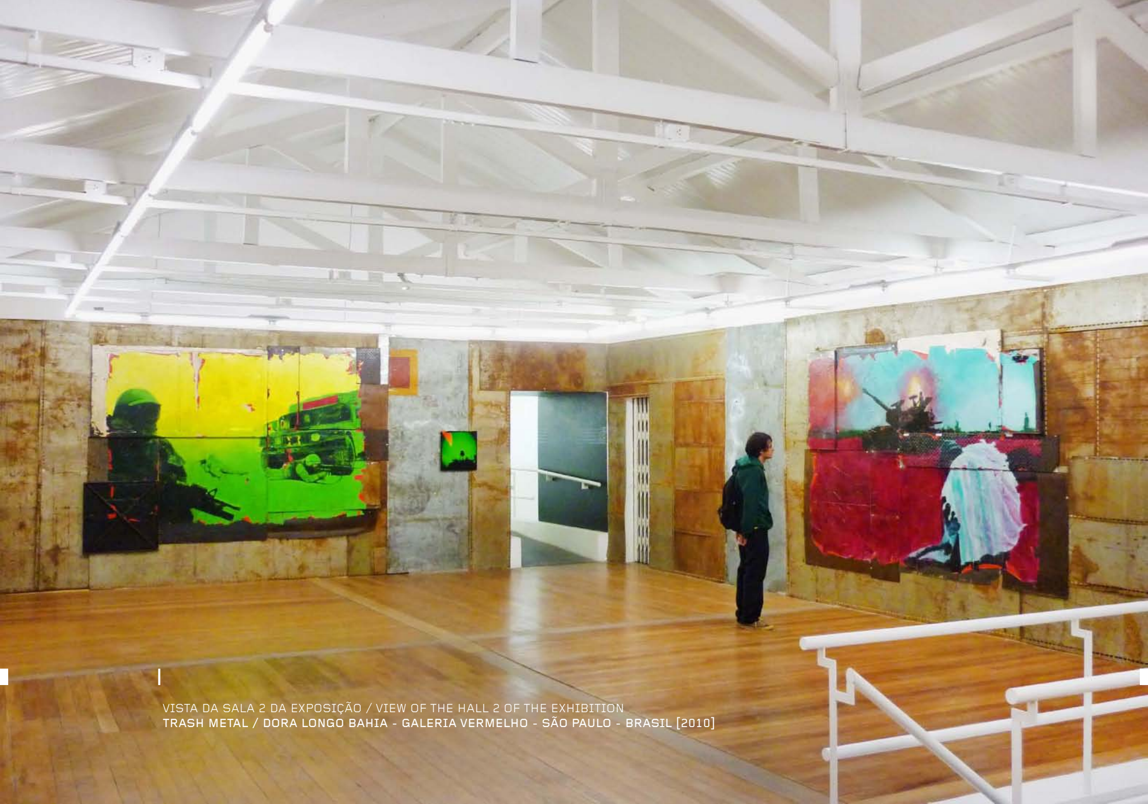
VISTA DA SALA 2 DA EXPOSIÇÃO / VIEW OF THE HALL 2 OF THE EXHIBITION TRASH METAL / DORA LONGO BAHIA - GALERIA VERMELHO - SÃO PAULO - BRASIL [2010]