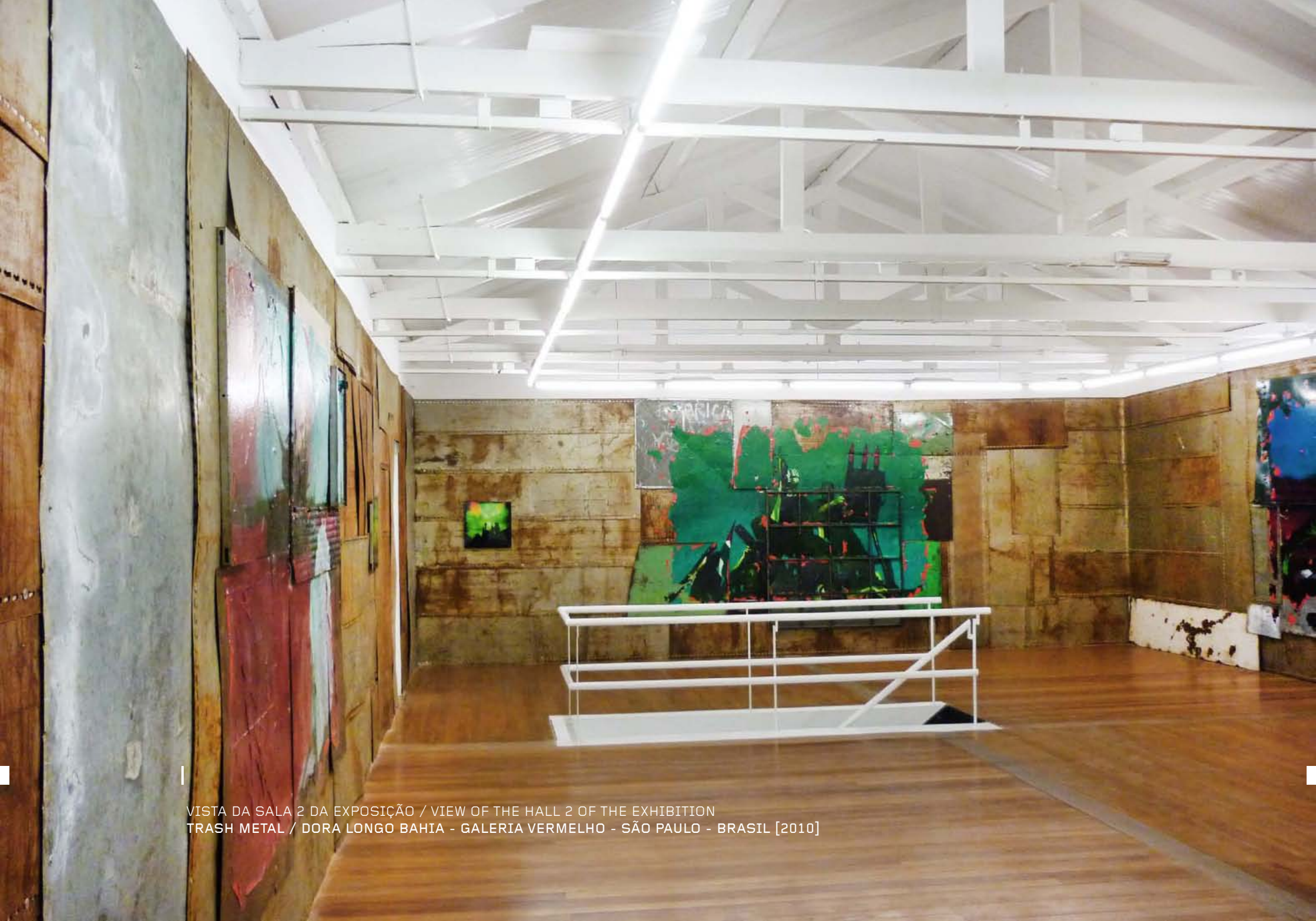
VISTA DA SALA 2 DA EXPOSIÇÃO / VIEW OF THE HALL 2 OF THE EXHIBITION TRASH METAL / DORA LONGO BAHIA - GALERIA VERMELHO - SÃO PAULO - BRASIL [2010]