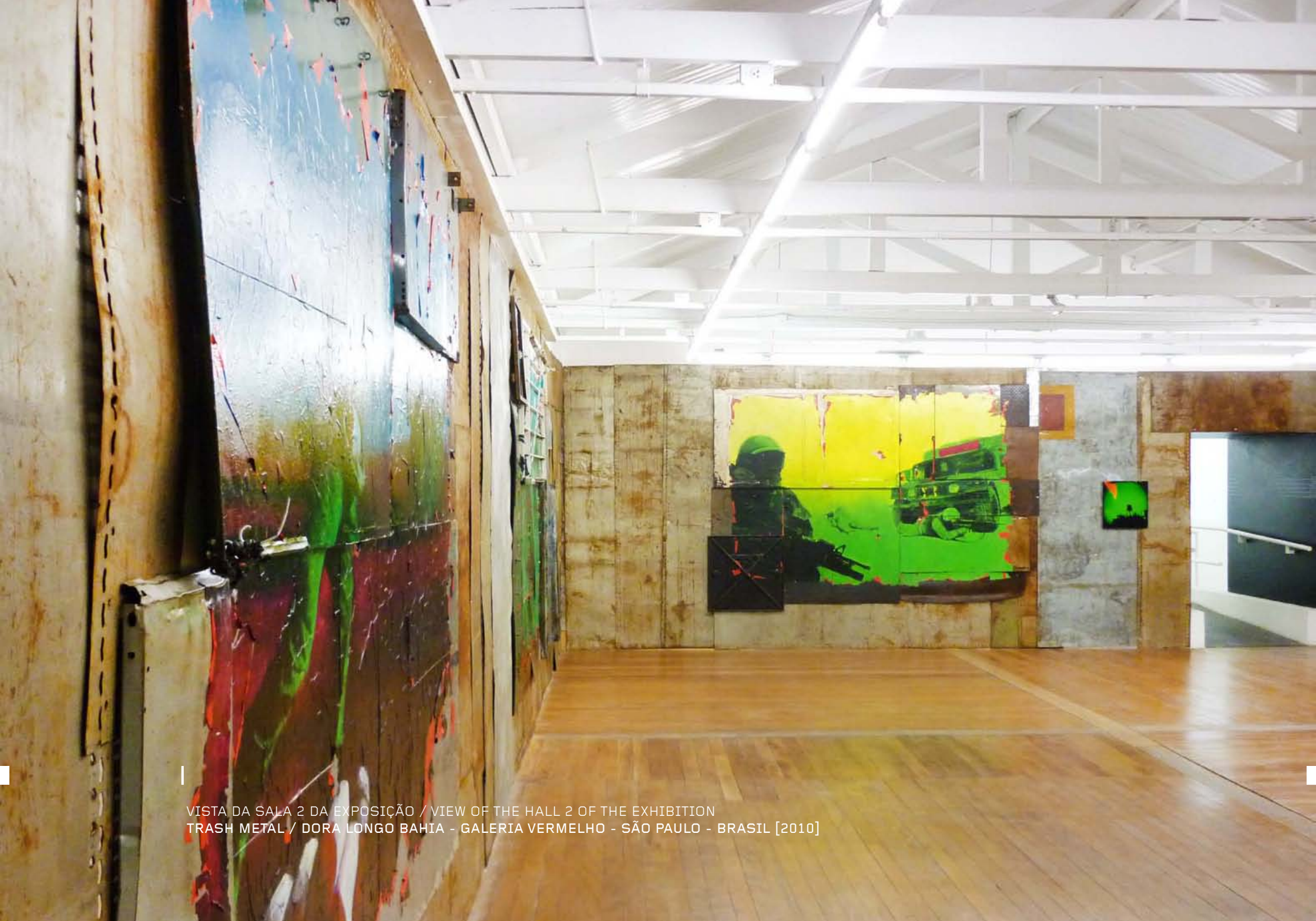
VISTA DA SALA 2 DA EXPOSIÇÃO / VIEW OF THE HALL 2 OF THE EXHIBITION TRASH METAL / DORA LONGO BAHIA - GALERIA VERMELHO - SÃO PAULO - BRASIL [2010]