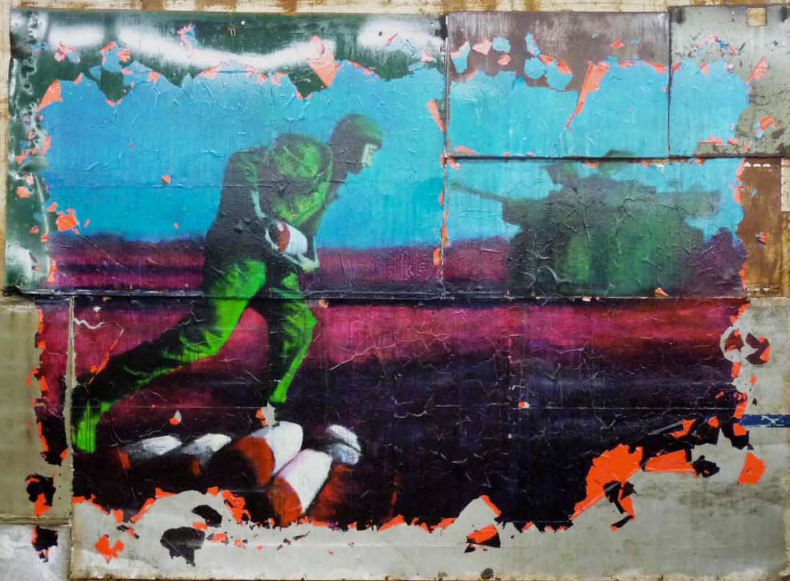
TÍTULO / TITLE ANO / YEAR DIMENSÕES / DIMENSIONS TÉCNICA / TECHNIQUE ESCALPO FERRADO [PAQUISTÃO] 2009-2010 247 X 357 CM TINTA ACRÍLICA APLICADA SOBRE FERRO VELHO