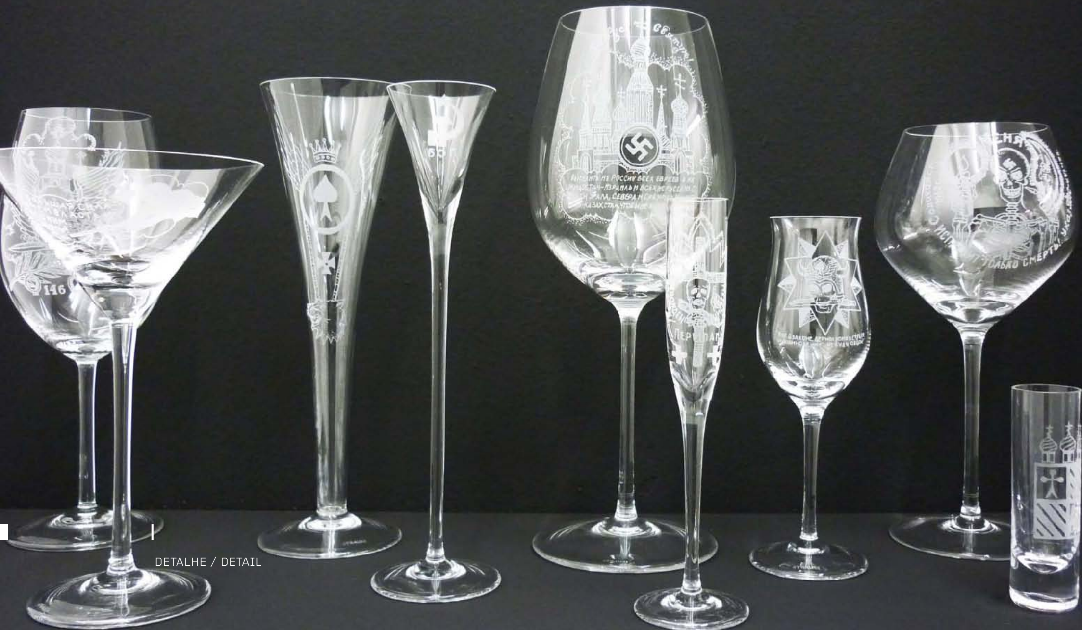
DETAIHE / DETAIL