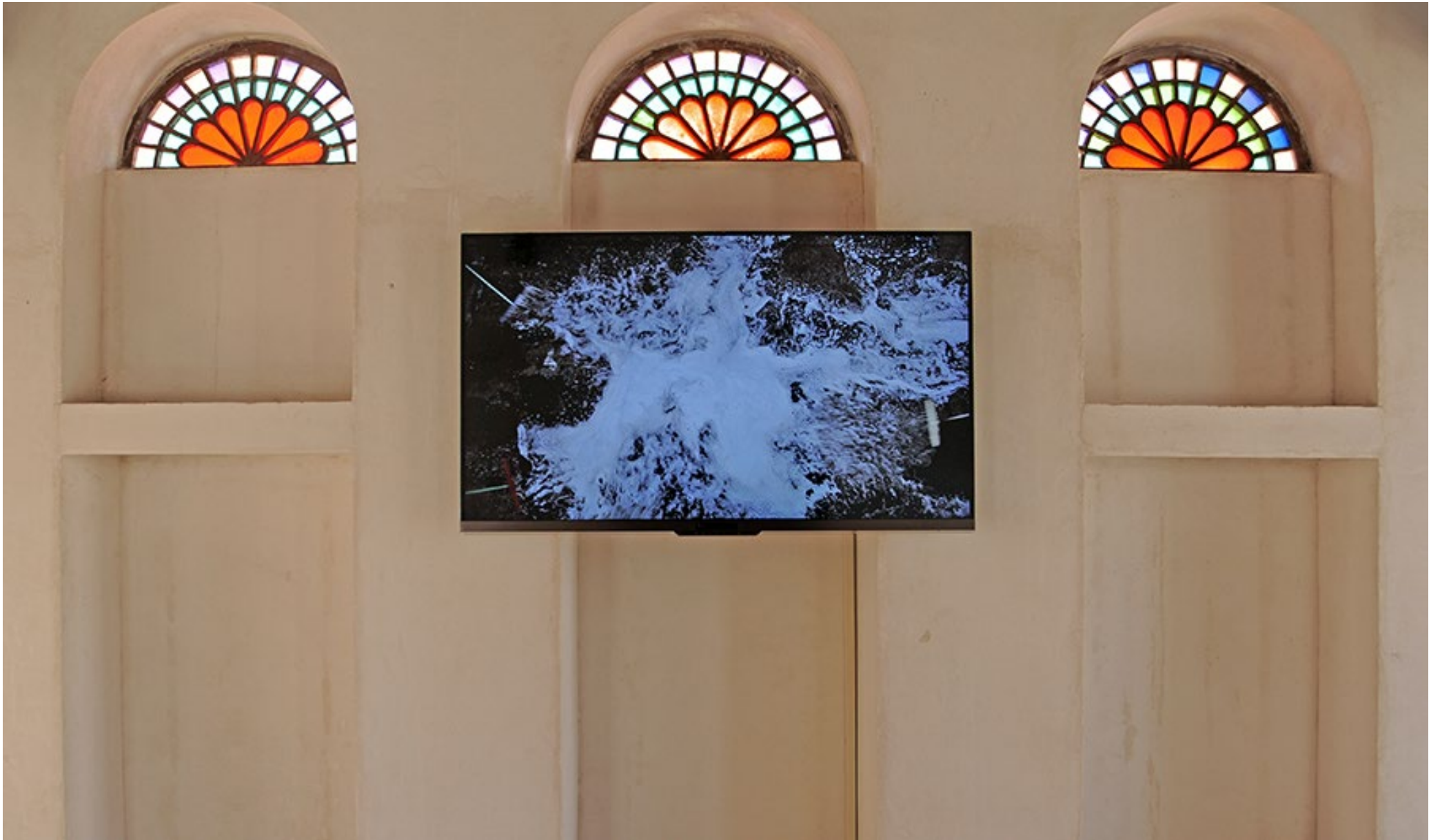
Leitmotiv 2013 Sharjah Biennial 11 - Sharjah - United Arab Emirates