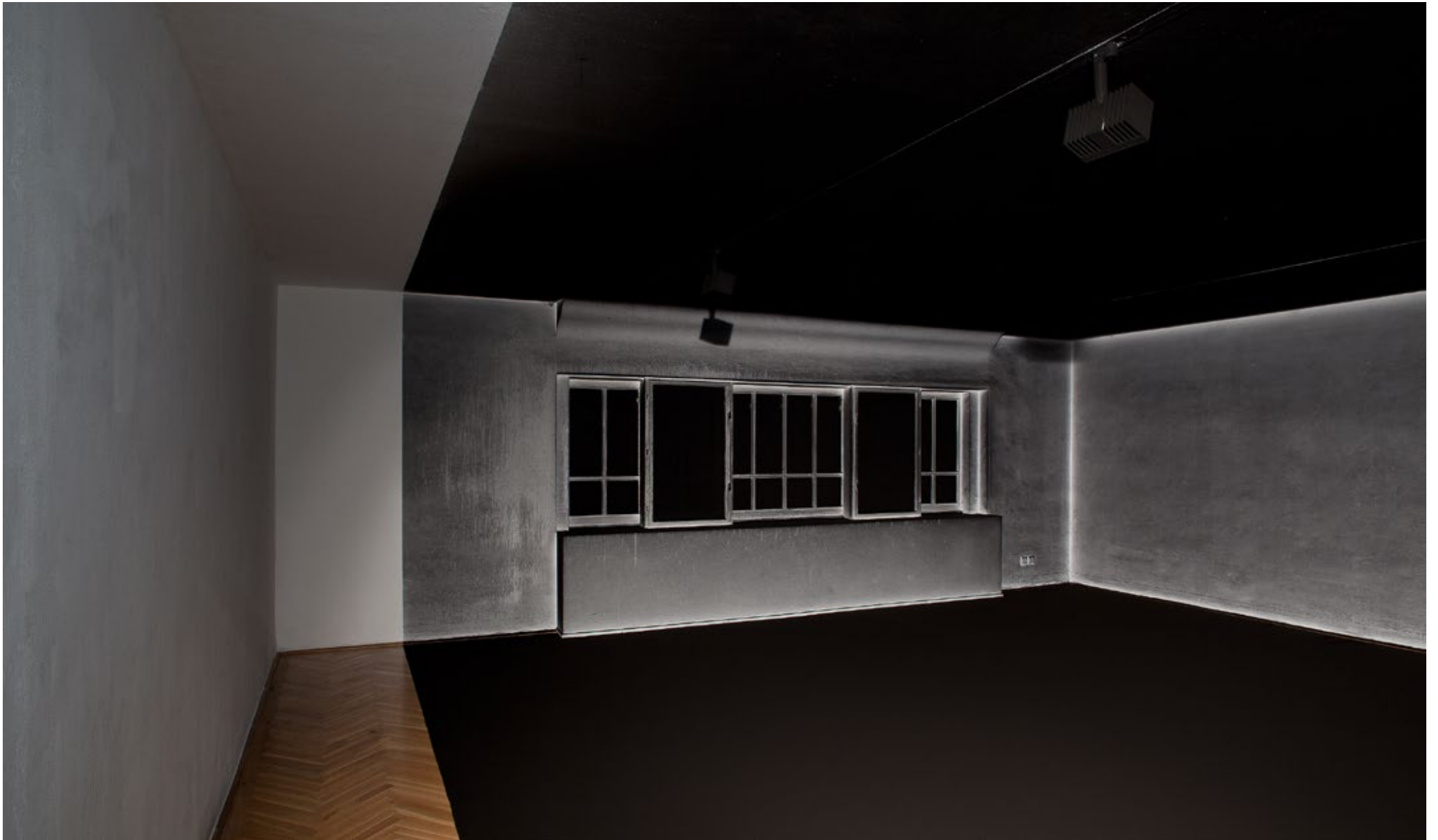
Dust Never Sleeps 2014 Secession - Vienna - Austria