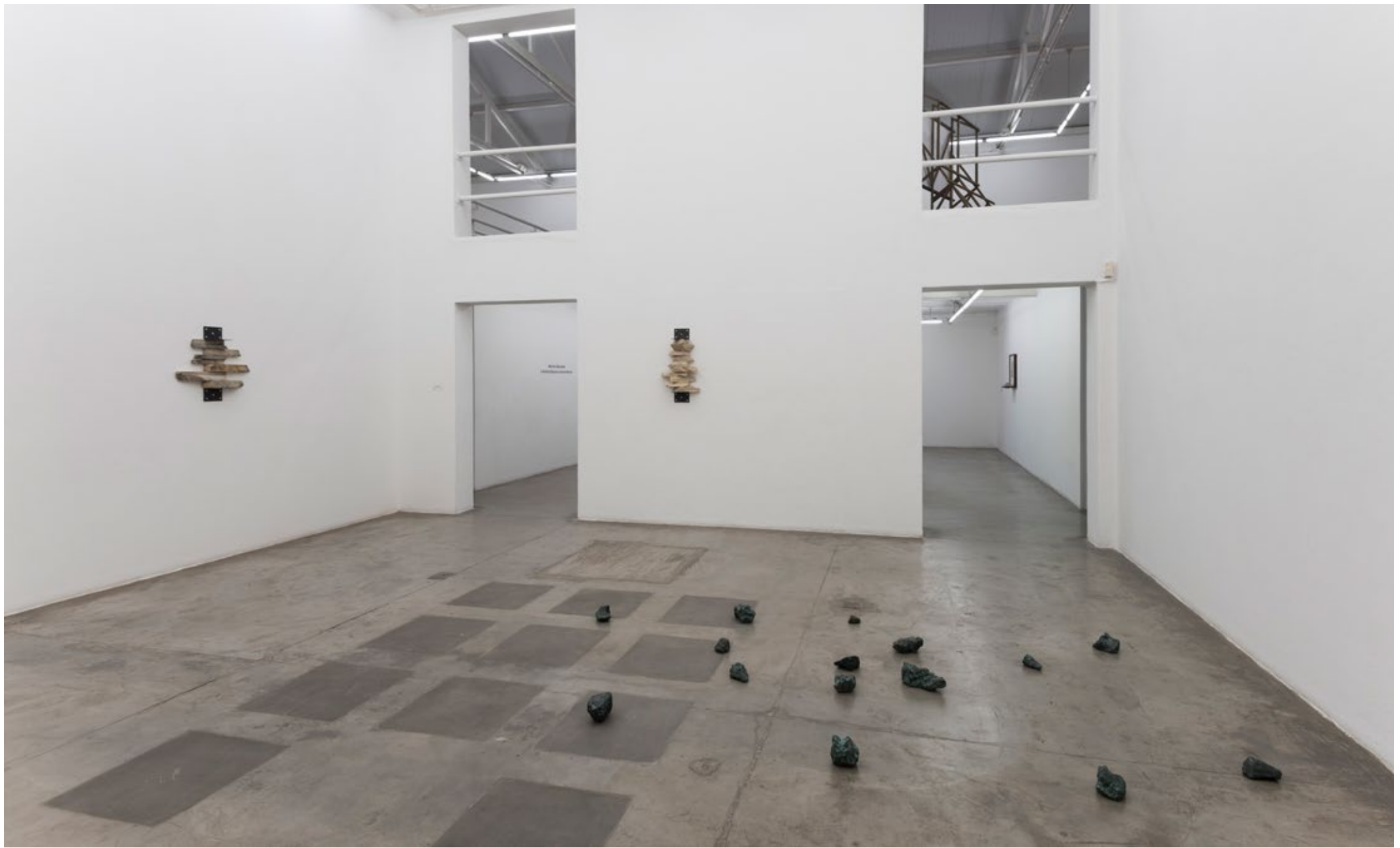
A história natural e outras ruínas 2018 Galeria Vermelho, São Paulo, Brazil