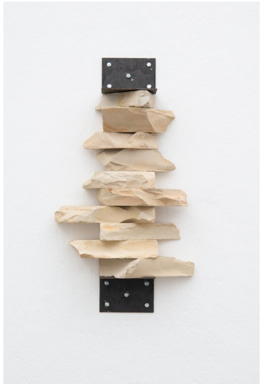
Egito 2018 71,5 x 40 cm lithographic stones and iron