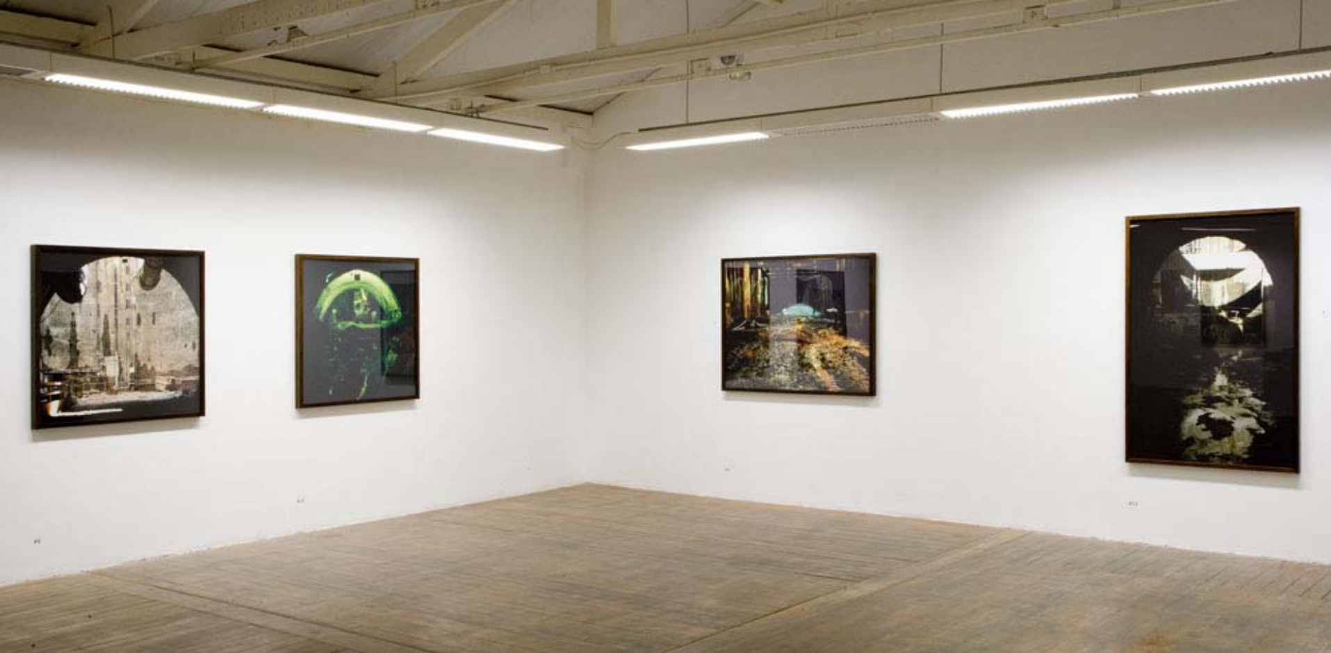
Vista da exposição 30M na Galeria Vermelho, São Paulo, Brasil, 2007. View of the exhibition 30M na Galeria Vermelho, São Paulo, Brasil, 2007.