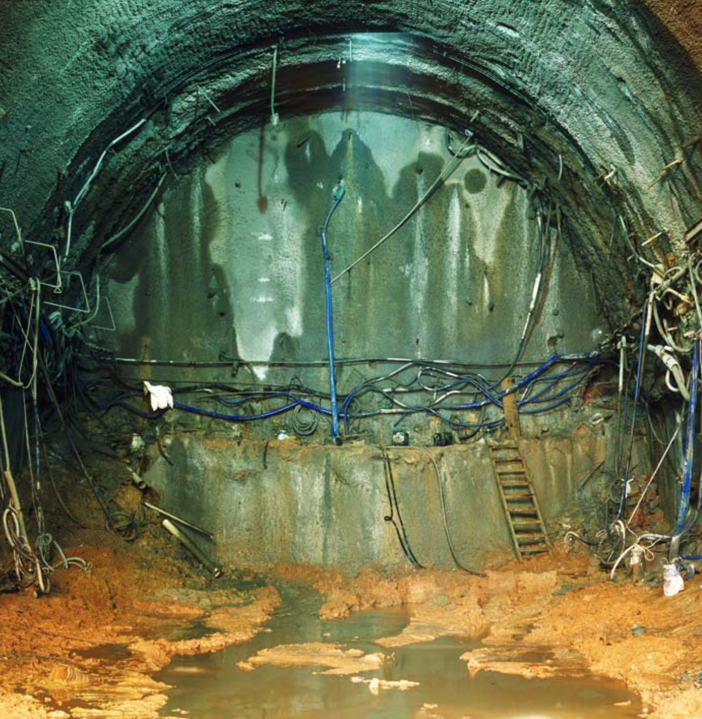
LINHA 4 #10 ESTAÇÃO OSCAR FREIRE /17.04.2006 100 x 100 cm