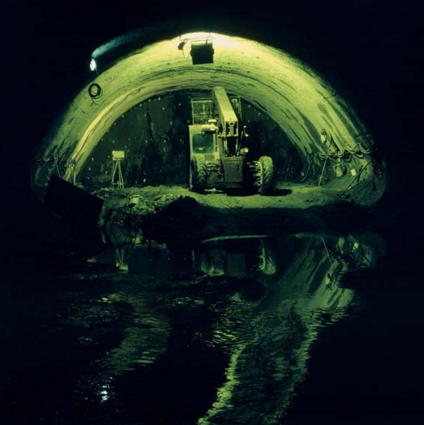
LINHA 4 #20 ESTAÇÃO MORUMBI (CAXINGUI) /04.11.2006 105 x 105 cm