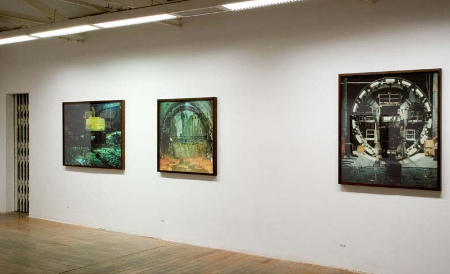
Vista da exposição 30M na Galeria Vermelho, São Paulo, Brasil, 2007. View of the exhibition 30M na Galeria Vermelho, São Paulo, Brasil, 2007.