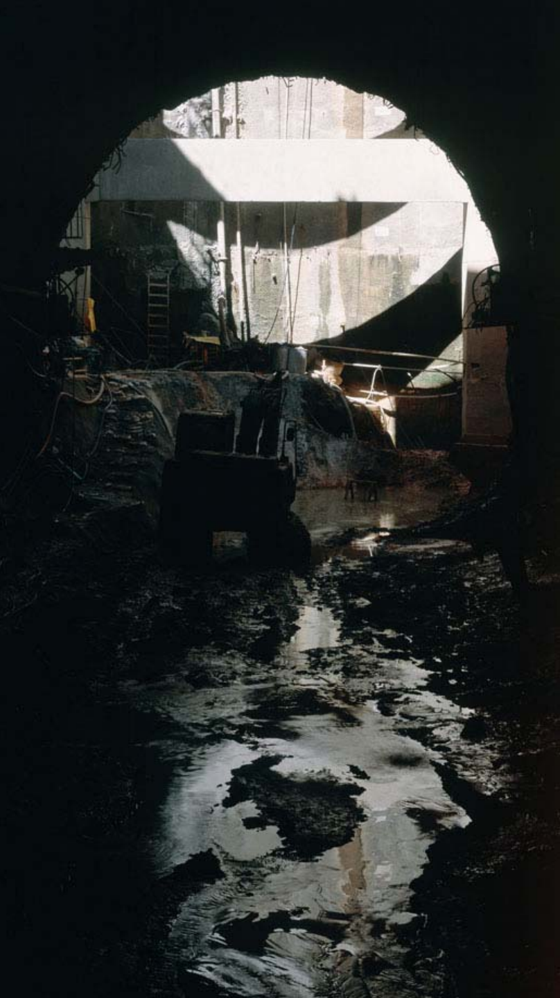
LINHA 4 #11 ESTAÇÃO OSCAR FREIRE /17.04.2006 180 x 108 cm