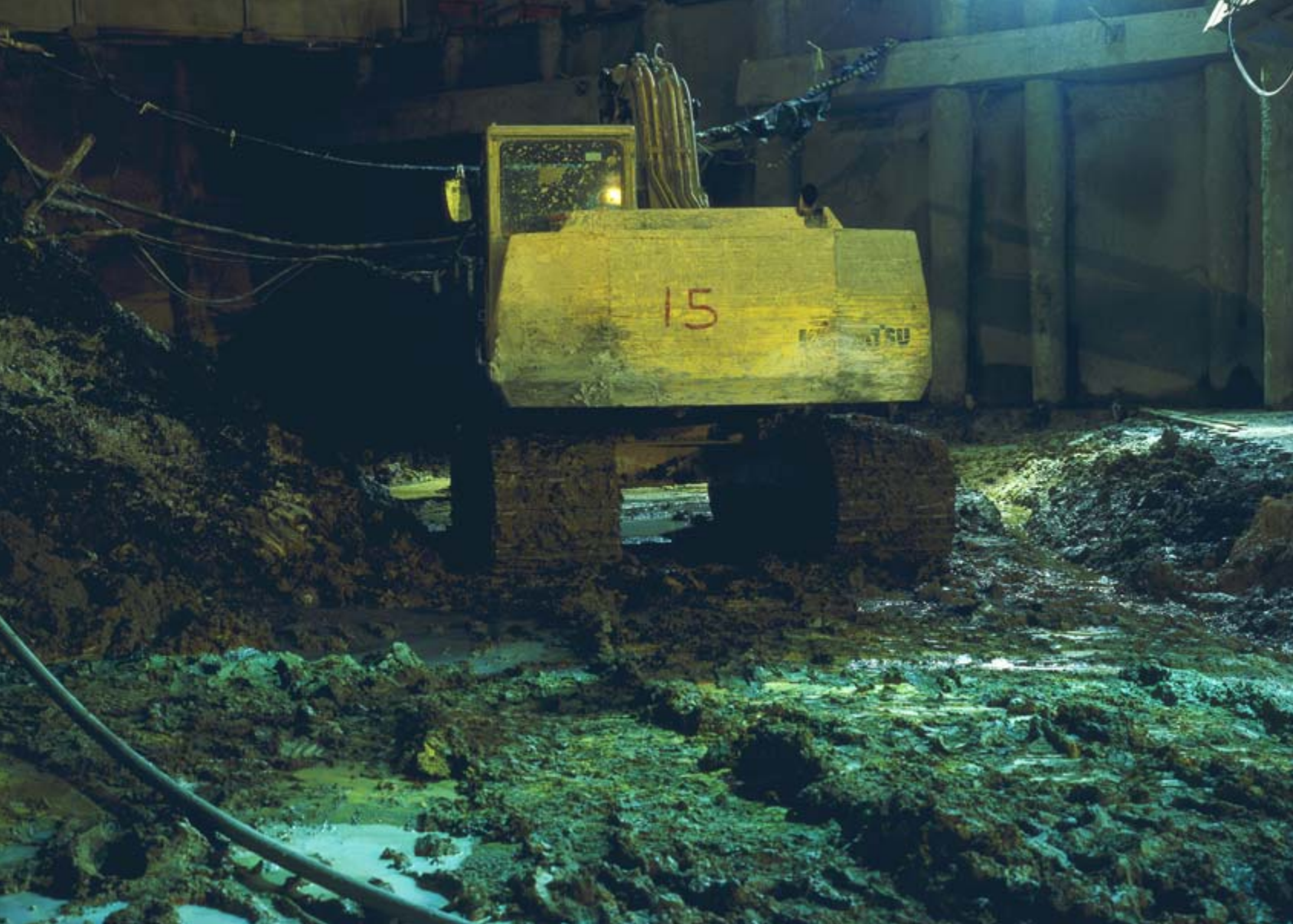
LINHA 4 #2 ESTAÇÃO FARIA LIMA /13.11.2005 100 x 137 cm