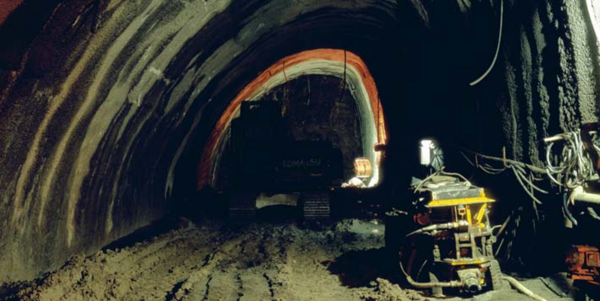
LINHA 4 #26 ESTAÇÃO HIGIENÓPOLIS (CONSOLAÇÃO) /18.01.2006 85 x 170 cm