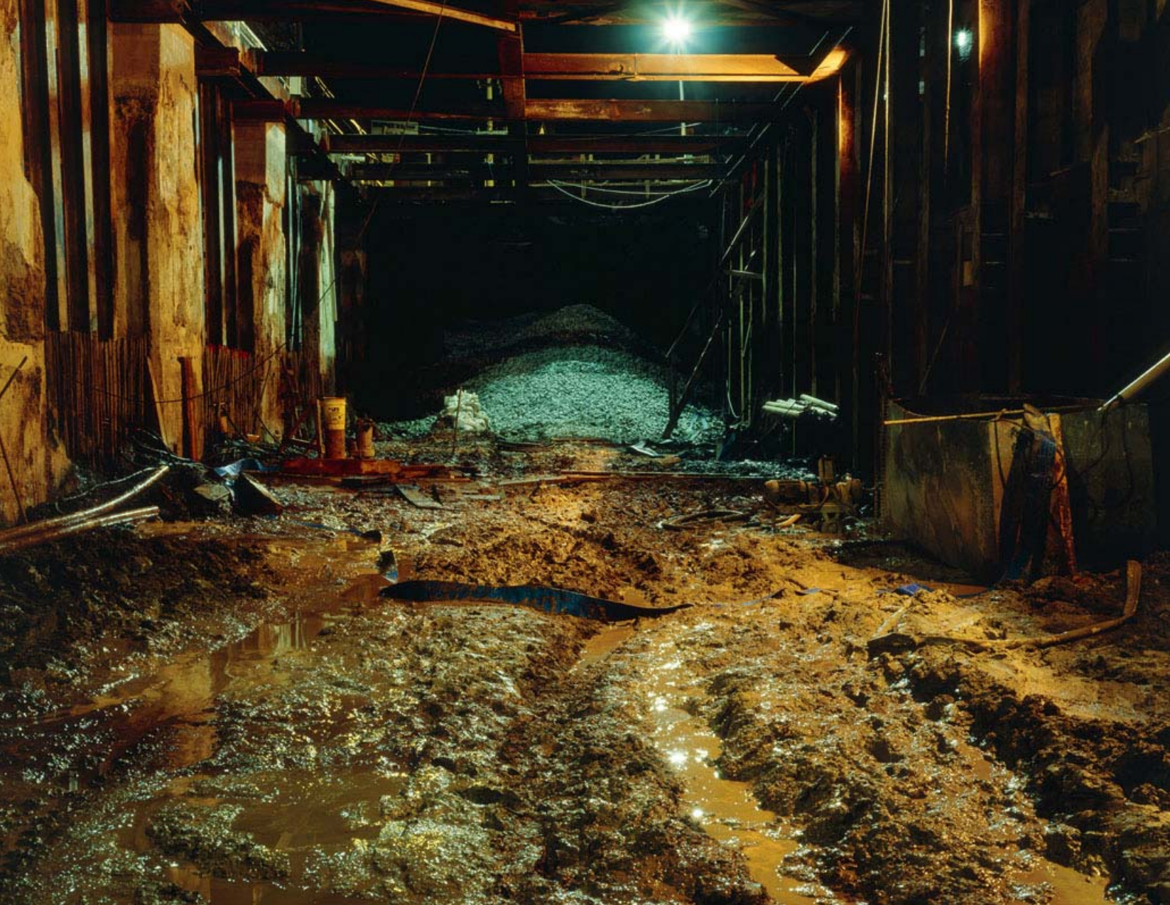
LINHA 4 #3 ESTAÇÃO FRADIQUE COUTINHO /27.11.2006 100 x 135 cm