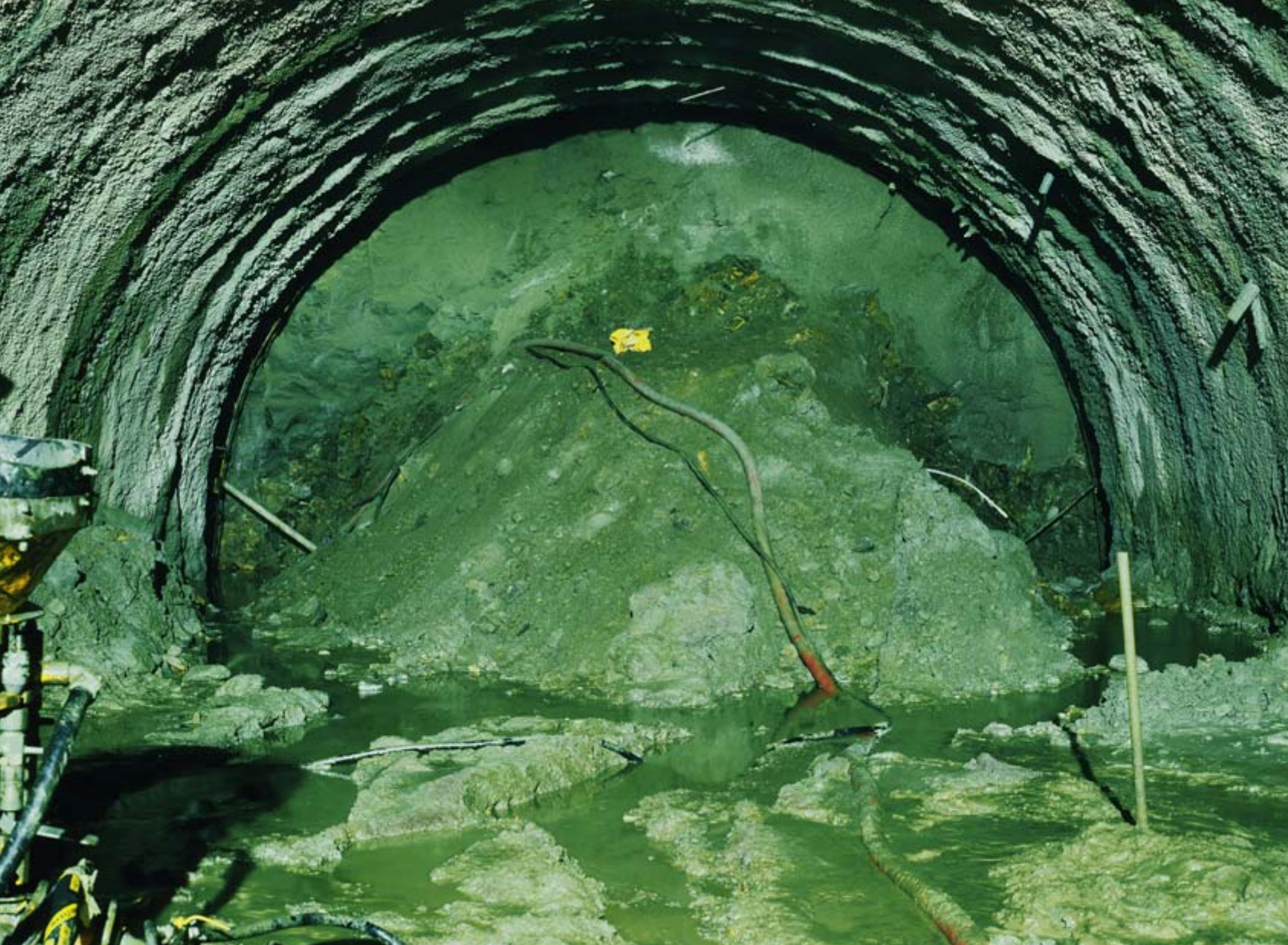
LINHA 4 #4 ESTAÇÃO PINHEIROS (FERREIRA DE ARAUJO) /16.12.2005 90 x 123 cm