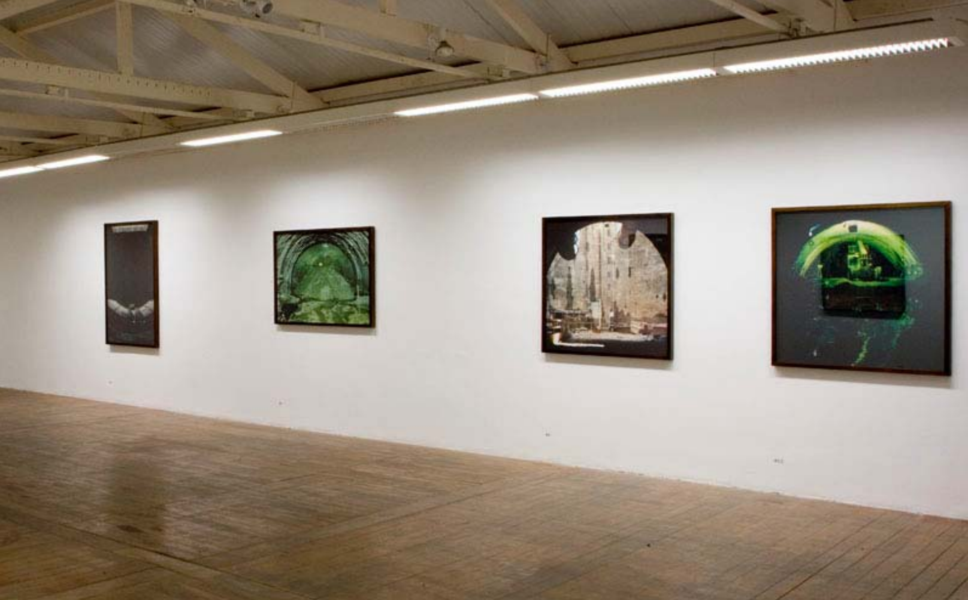
Vista da exposição 30M na Galeria Vermelho, São Paulo, Brasil, 2007. View of the exhibition 30M na Galeria Vermelho, São Paulo, Brasil, 2007.