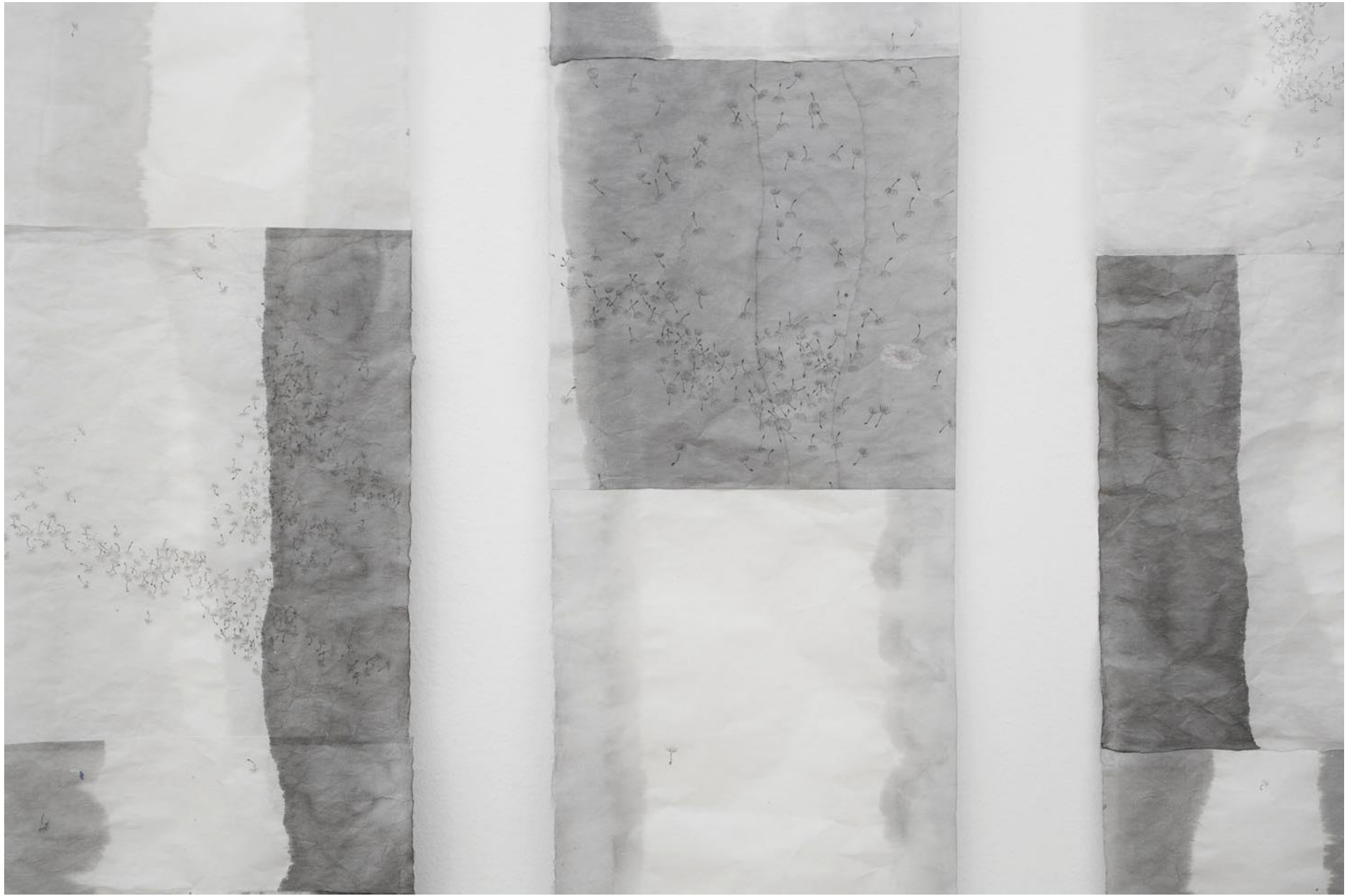
Chiara Banfi Wishes (2009) Detail/ detail