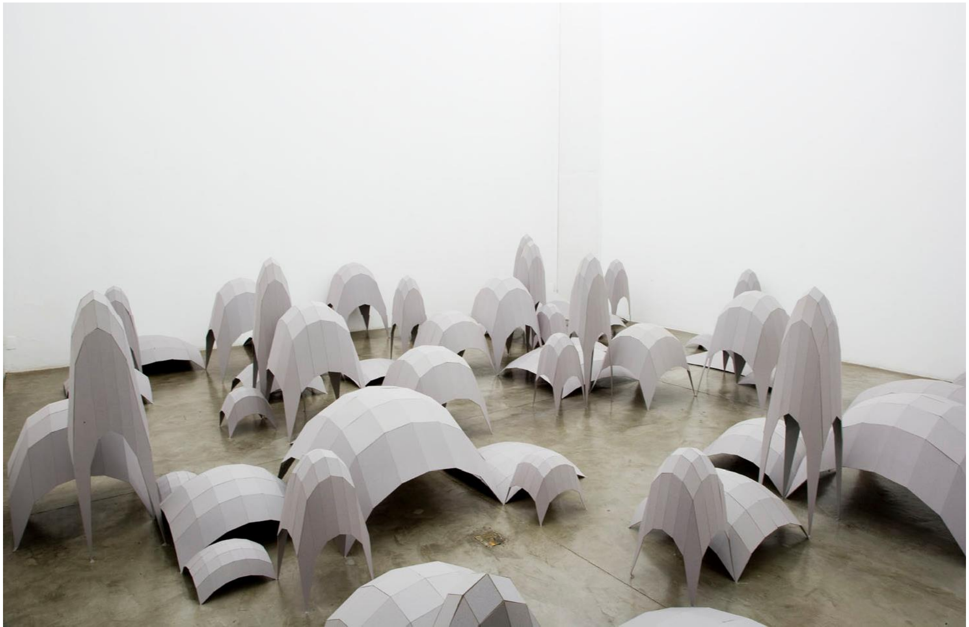
Vista da instalação Topografias Simuladas (2007) de Héctor Zamora - Galeria Vermelho — São Paulo — Brasil View of the installation Simulated Topographies (2007) by Héctor Zamora - Galeria Vermelho — São Paulo — Brasil