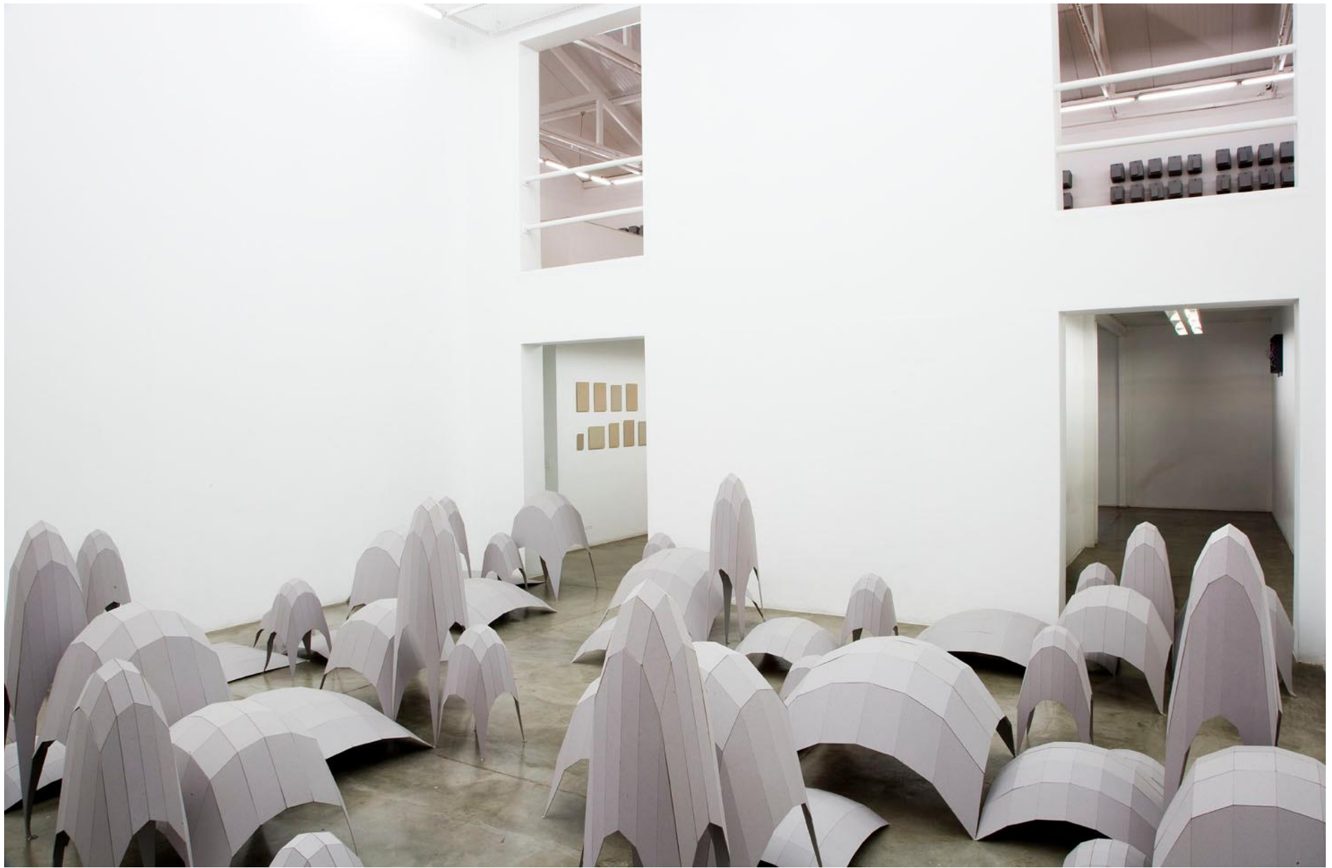
Vista da instalação Topografias Simuladas (2007) de Héctor Zamora - Galeria Vermelho — São Paulo — Brasil View of the installation Simulated Topographies (2007) by Héctor Zamora - Galeria Vermelho — São Paulo — Brasil