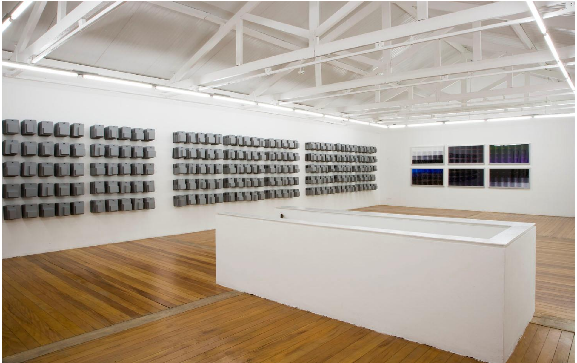
Vista da instalação Mercado Neutro (2008) de Marcelo Cidade - Galeria Vermelho — São Paulo — Brasil View of the installation Mercado Neutro (2008) by Marcelo Cidade - Galeria Vermelho — São Paulo — Brasil