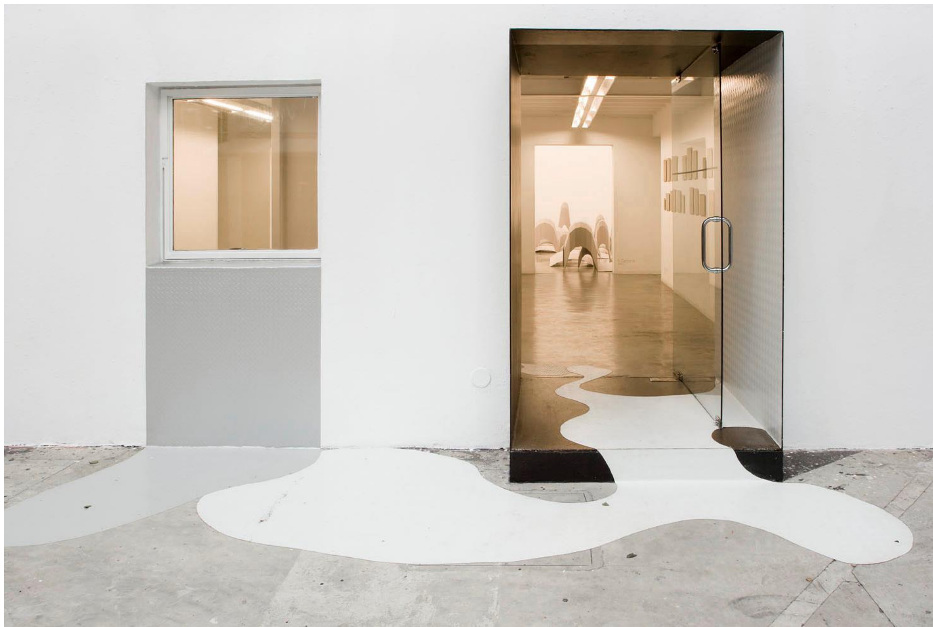
Vista da instalação/ partial view of Trilhas (2009) de /by Chiara Banfi - Fachada/ Façade Galeria Vermelho — São Paulo — Brasil