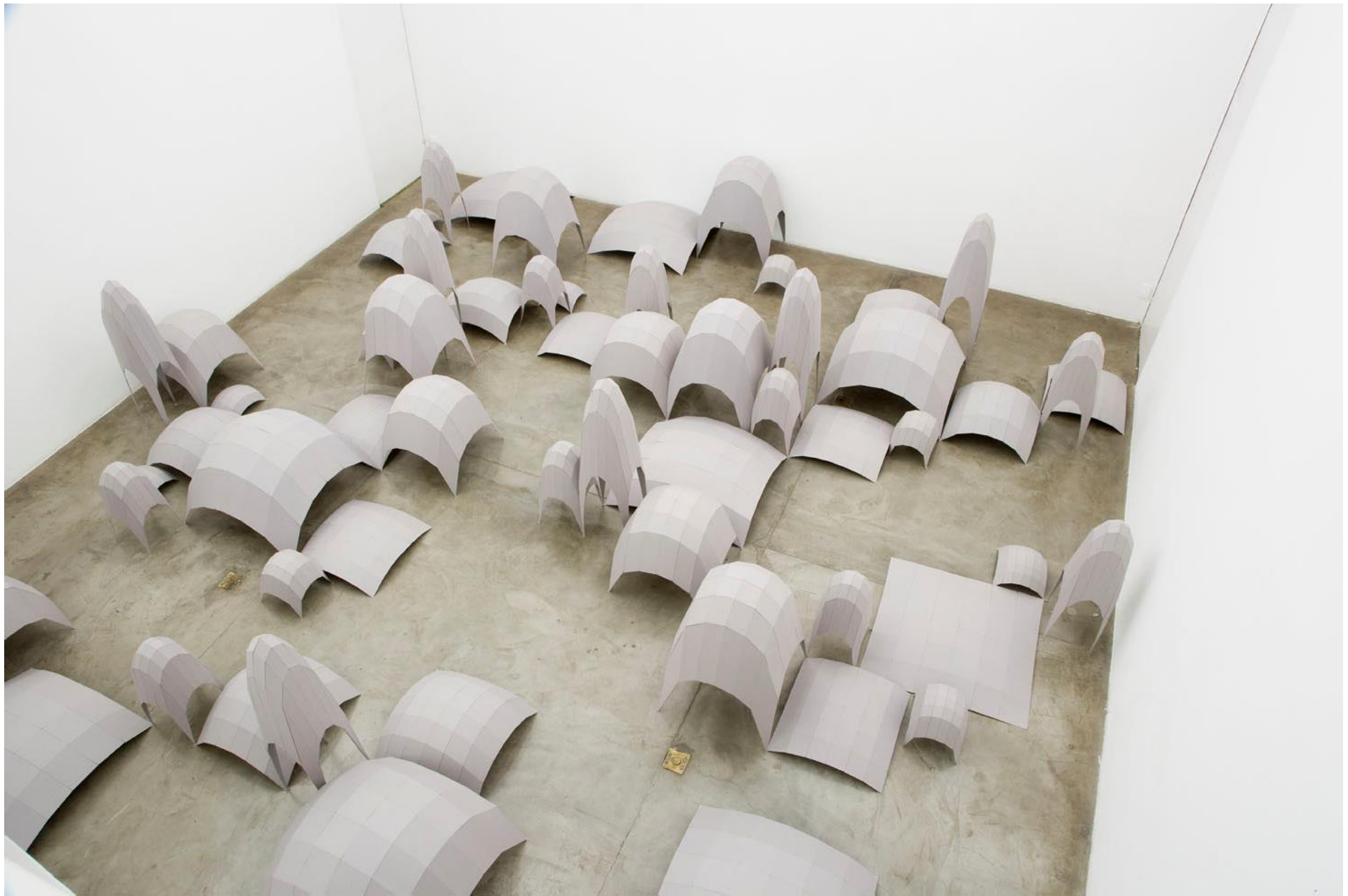
Vista da instalação Topografias Simuladas (2007) de Héctor Zamora - Galeria Vermelho — São Paulo — Brasil View of the installation Simulated Topographies (2007) by Héctor Zamora - Galeria Vermelho — São Paulo — Brasil