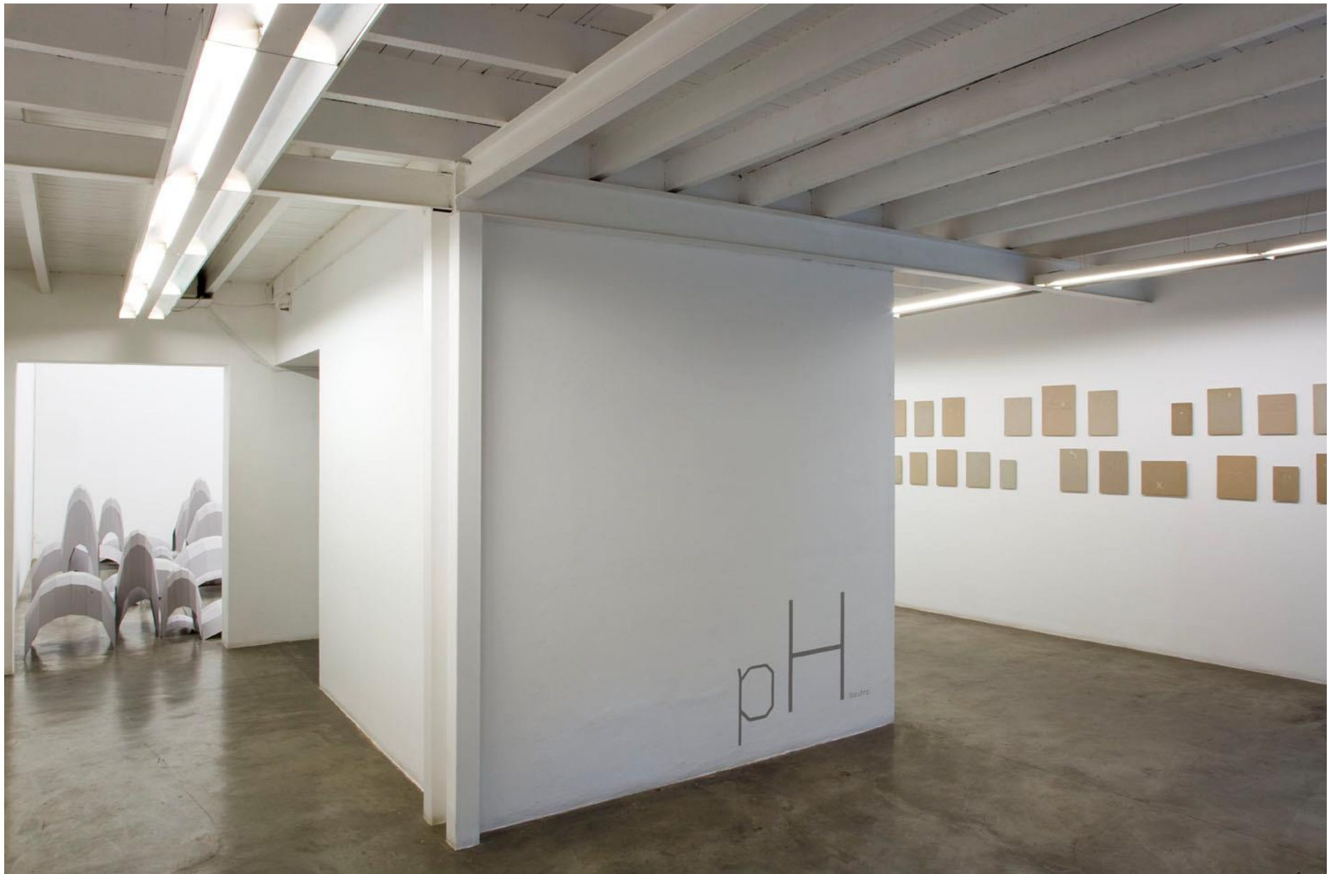
Vista da entrada da exposição pH NEUTRO — Galeria Vermelho — São Paulo — Brasil (fevereiro de 2009) Entrance pH NEUTRO - Galeria Vermelho — São Paulo — Brasil (Feb 2009)