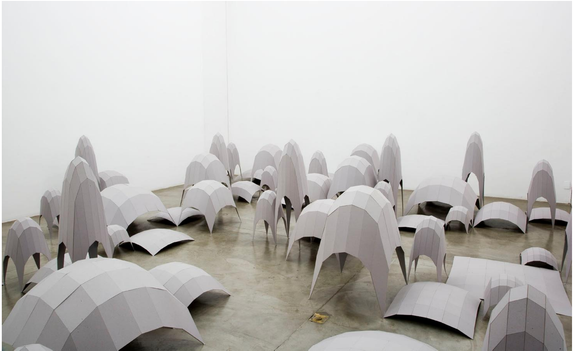
Vista da instalação Topografias Simuladas (2007) de Héctor Zamora - Galeria Vermelho — São Paulo — Brasil View of the installation Simulated Topographies (2007) by Héctor Zamora - Galeria Vermelho — São Paulo — Brasil