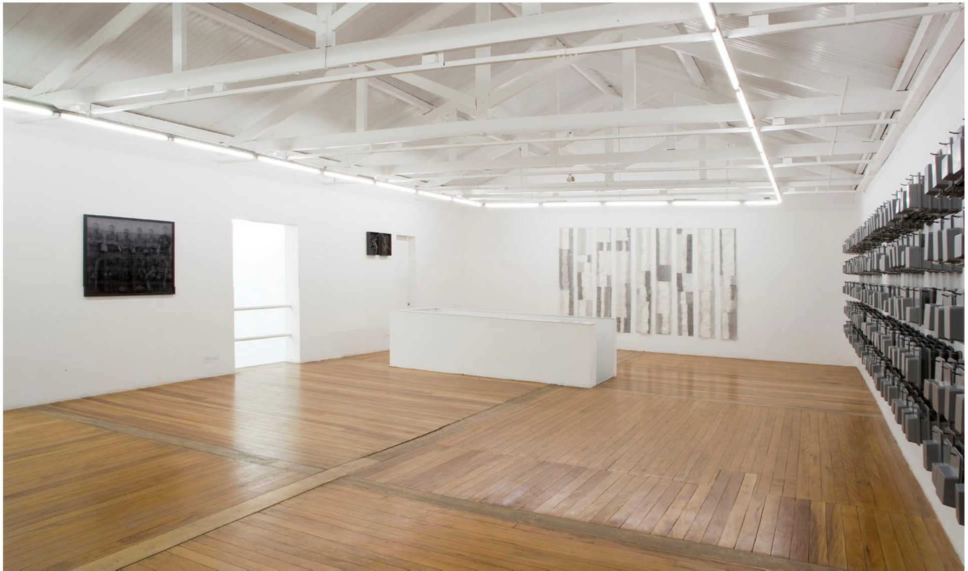
Vista do primeiro andar da exposição pH NEUTRO — Galeria Vermelho — São Paulo — Brasil (fevereiro de 2009) Partial view of pH NEUTRO — Galeria Vermelho — São Paulo — Brasil (Feb 2009)