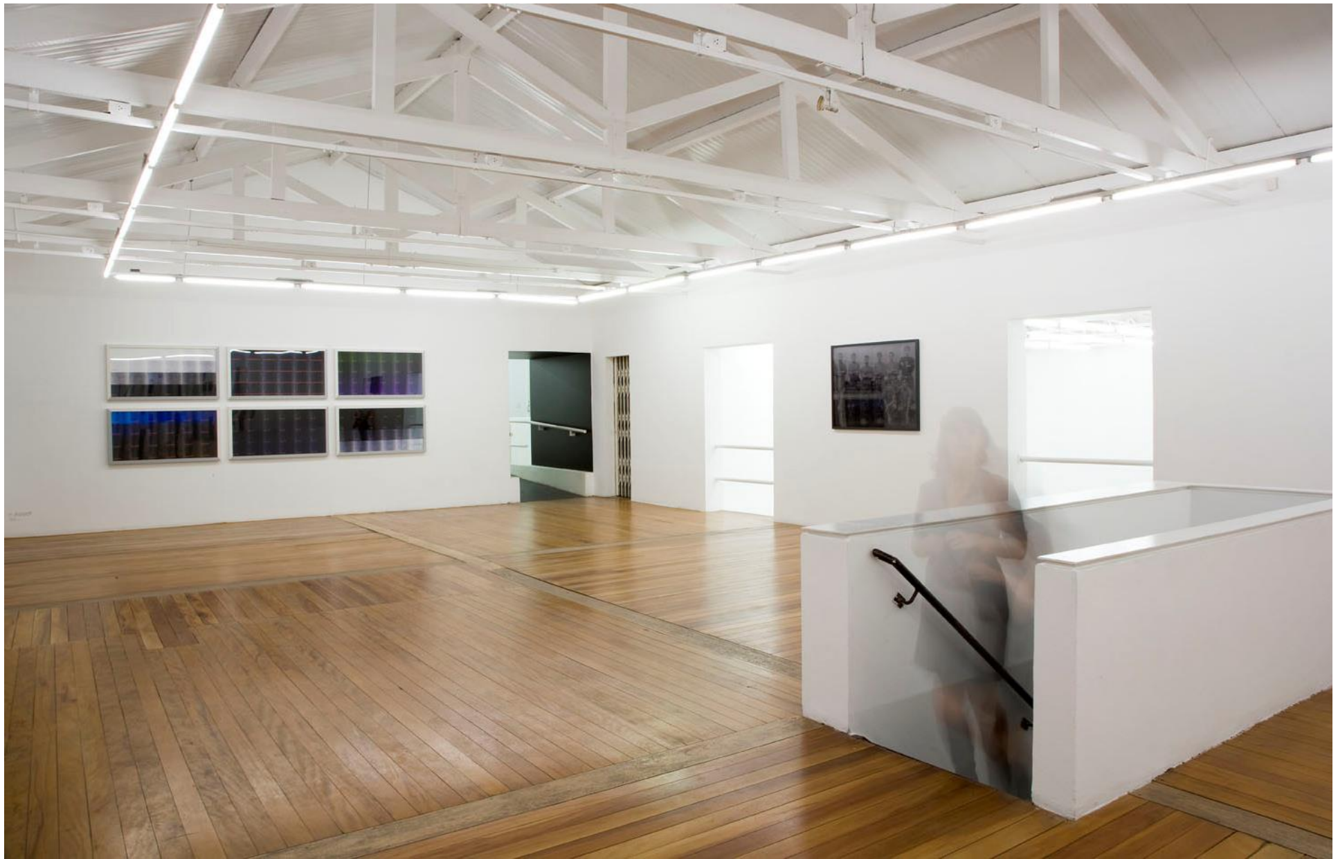
Vista do primeiro andar da exposição pH NEUTRO — Galeria Vermelho — São Paulo — Brasil (fevereiro de 2009) Partial view of pH NEUTRO — Galeria Vermelho — São Paulo — Brasil (Feb 2009)