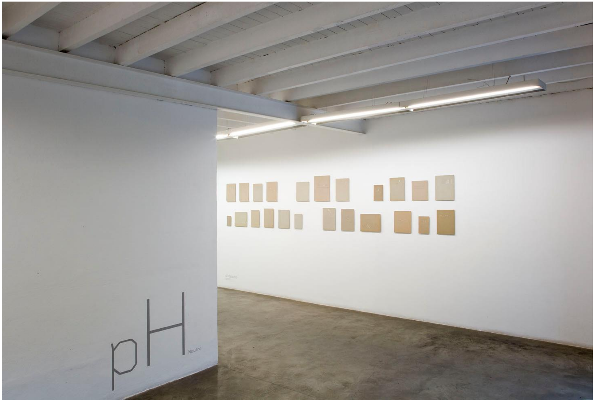
Vista da entrada da exposição pH NEUTRO — Galeria Vermelho — São Paulo — Brasil (fevereiro de 2009) Entrance pH NEUTRO - Galeria Vermelho — São Paulo — Brasil (Feb 2009)