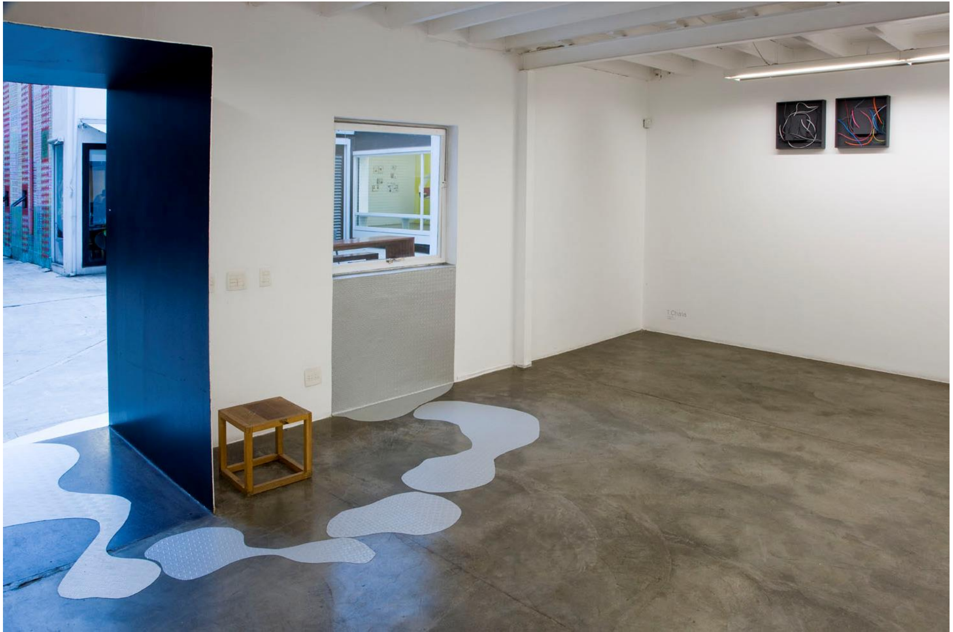
Vista da instalação/ partial view of Trilhas (2009) de /by Chiara Banfi - Fachada/ Façade Galeria Vermelho — São Paulo — Brasil