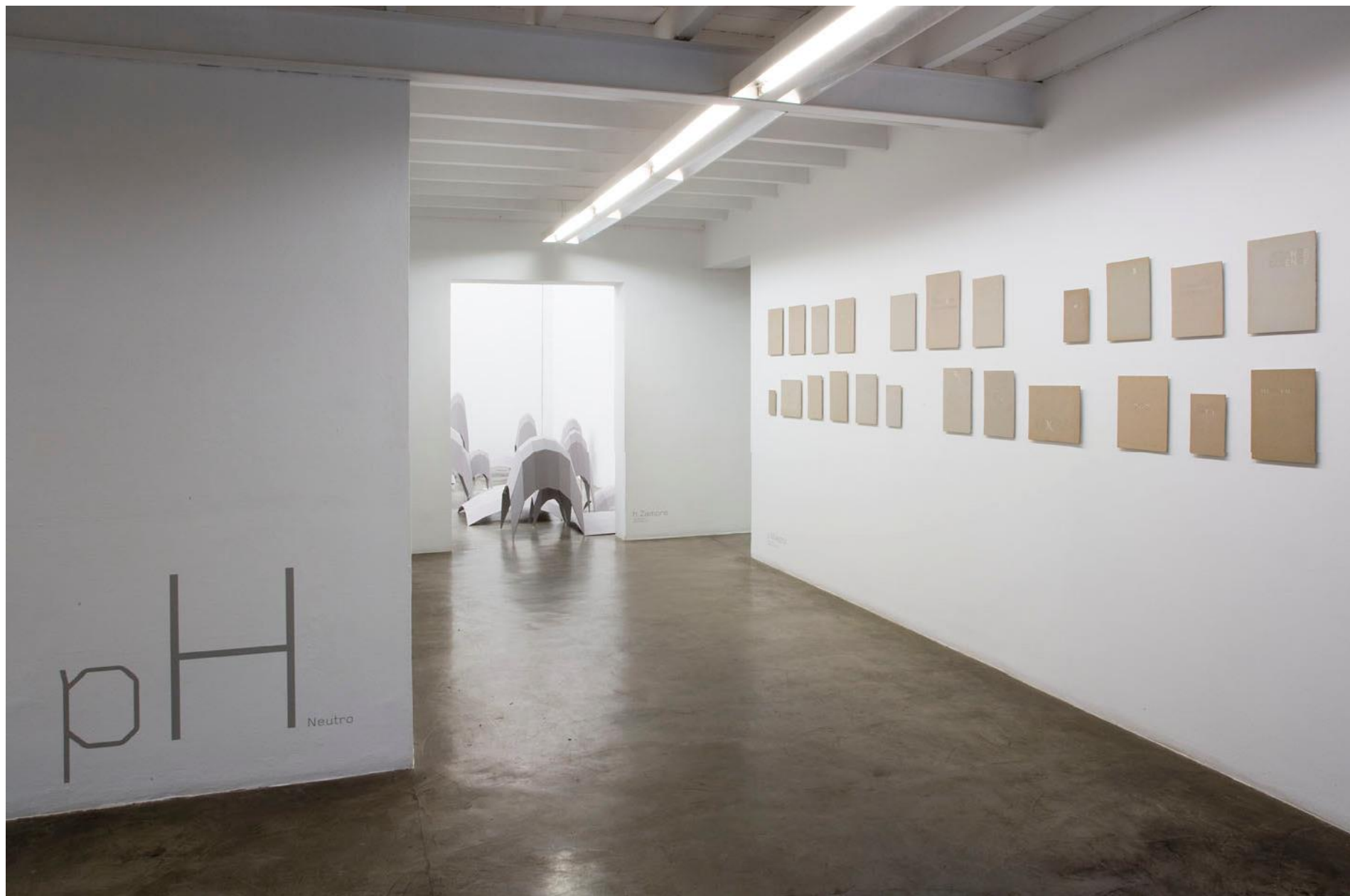
Vista da entrada da exposição pH NEUTRO — Galeria Vermelho — São Paulo — Brasil (fevereiro de 2009) Entrance pH NEUTRO - Galeria Vermelho — São Paulo — Brasil (Feb 2009)