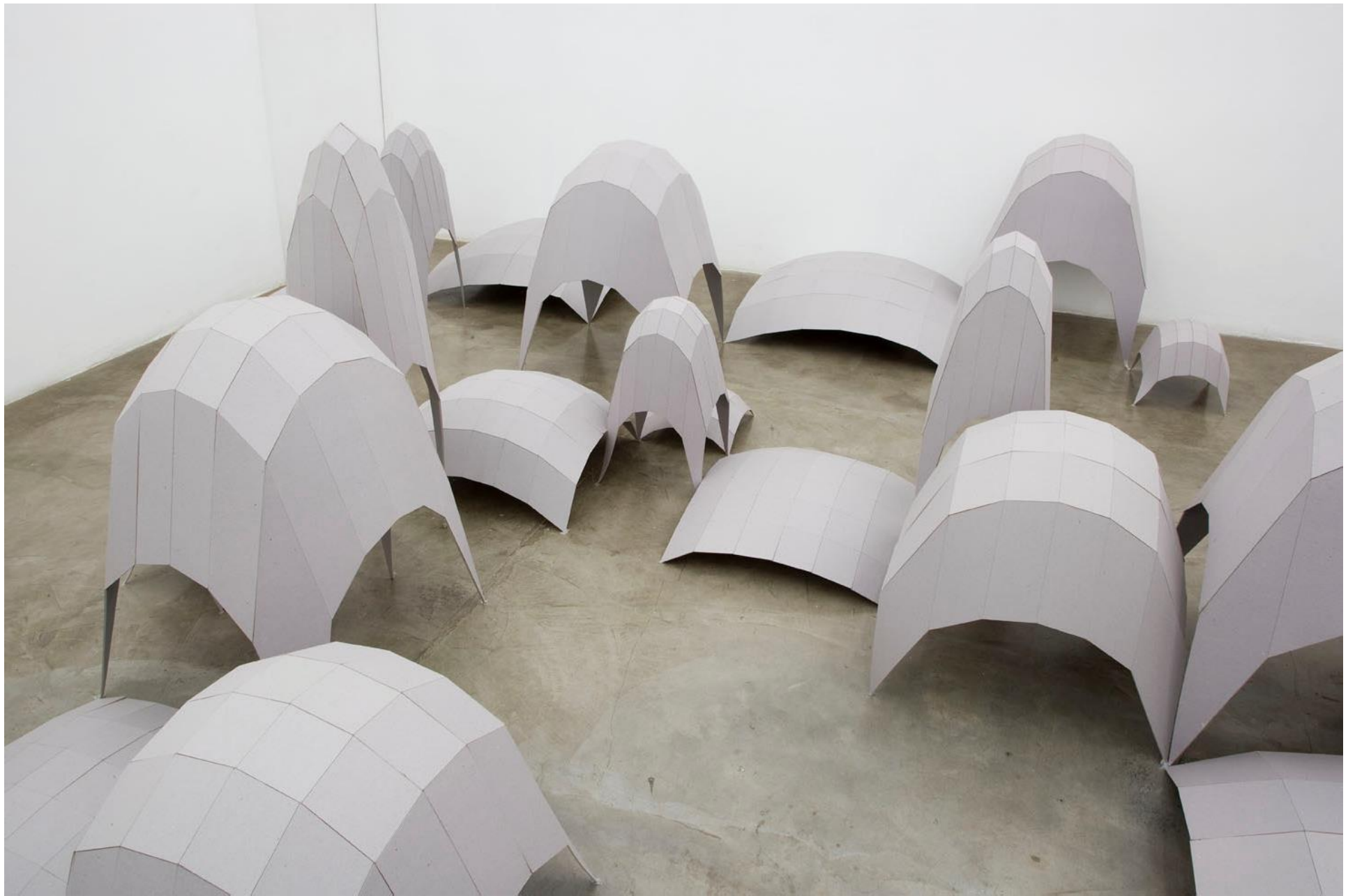
Vista da instalação Topografias Simuladas (2007) de Héctor Zamora - Galeria Vermelho — São Paulo — Brasil View of the installation Simulated Topographies (2007) by Héctor Zamora - Galeria Vermelho — São Paulo — Brasil