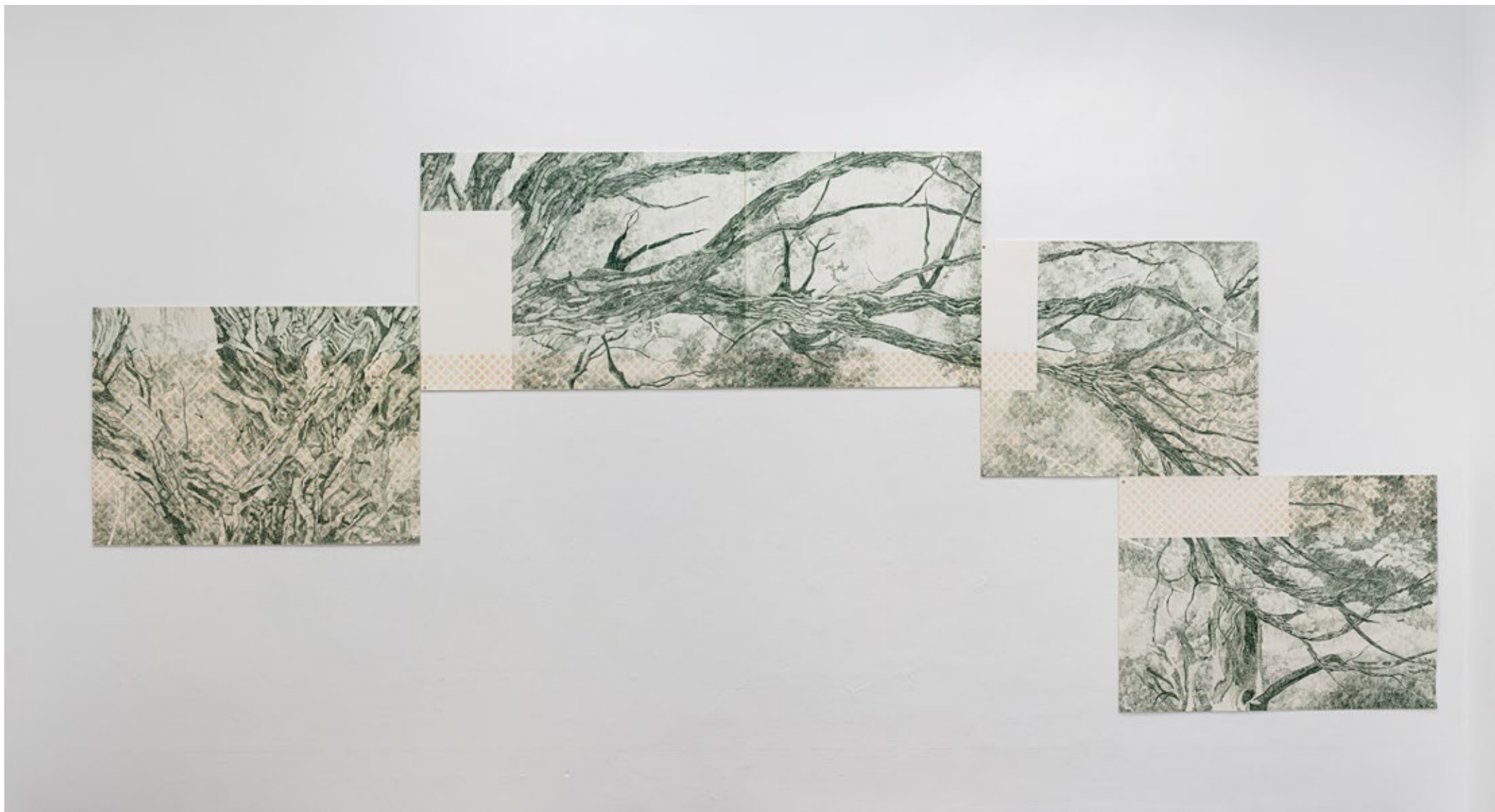
Utopia #1 (Dalbergia miscolobium Benth)