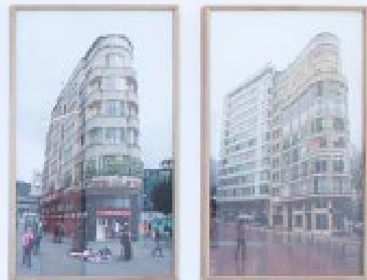
VISTA DA SALA 3 / VIEW OF THE HALL 3 CERÂMICA 6 LTDA. HÉCTOR ZAMORA- GALERIA VERMELHO- SÃO PAULO- BRASIL[2010]