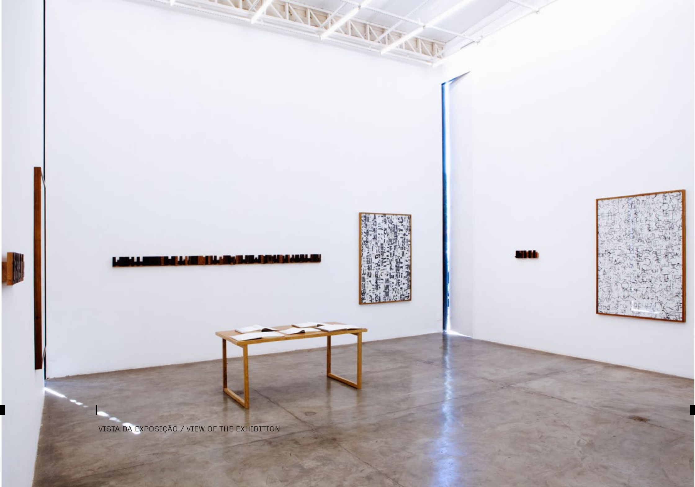
VISTA DA EXPOSIÇÃO / VIEW OF THE EXHIBITION