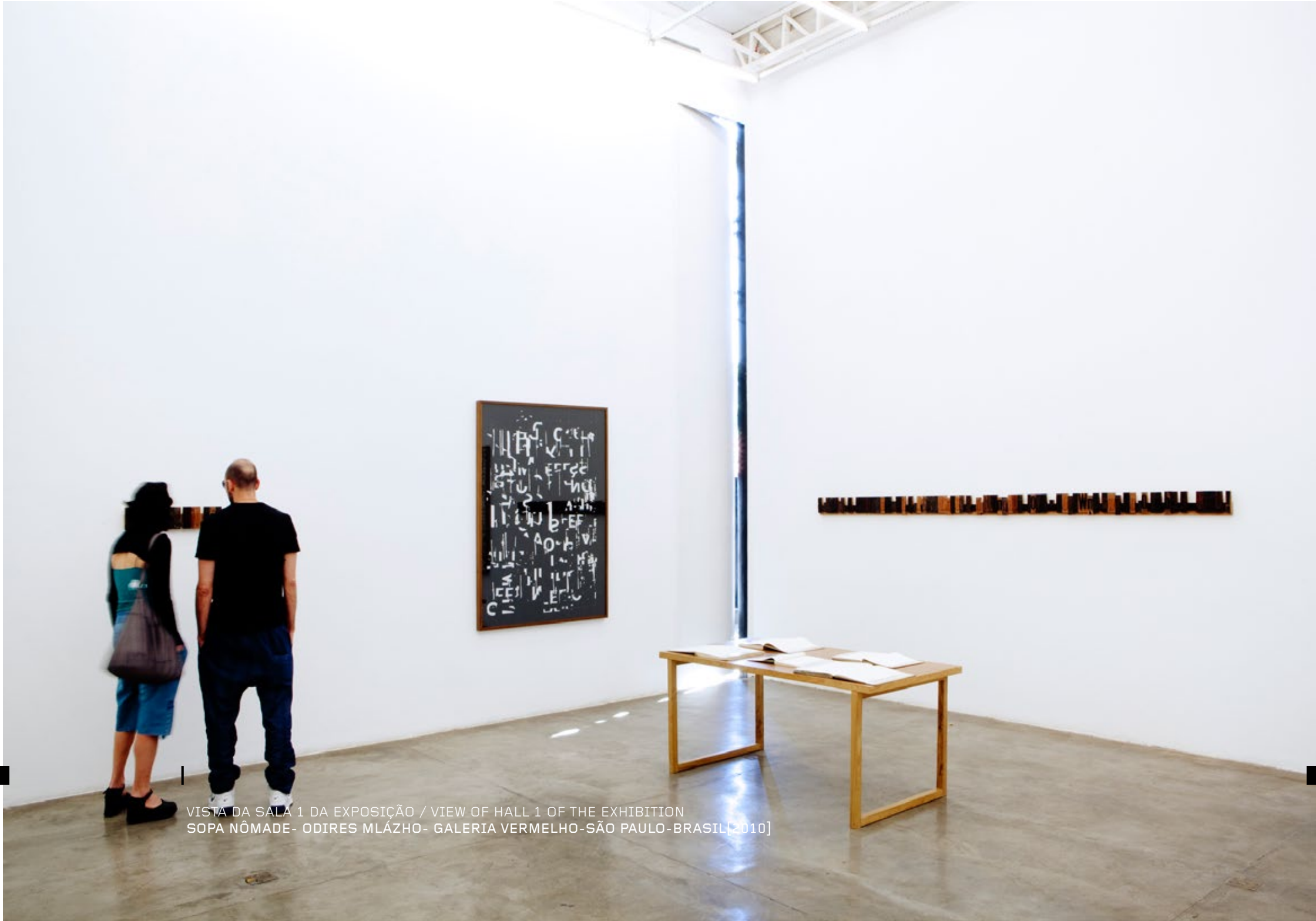
VISTA DA SALA 1 DA EXPOSIÇÃO / VIEW OF HALL 1 OF THE EXHIBITION SOPA NÔMADE- ODIRES MLÁZHO- GALERIA VERMELHO-SÃO PAULO-BRASIL [2010]