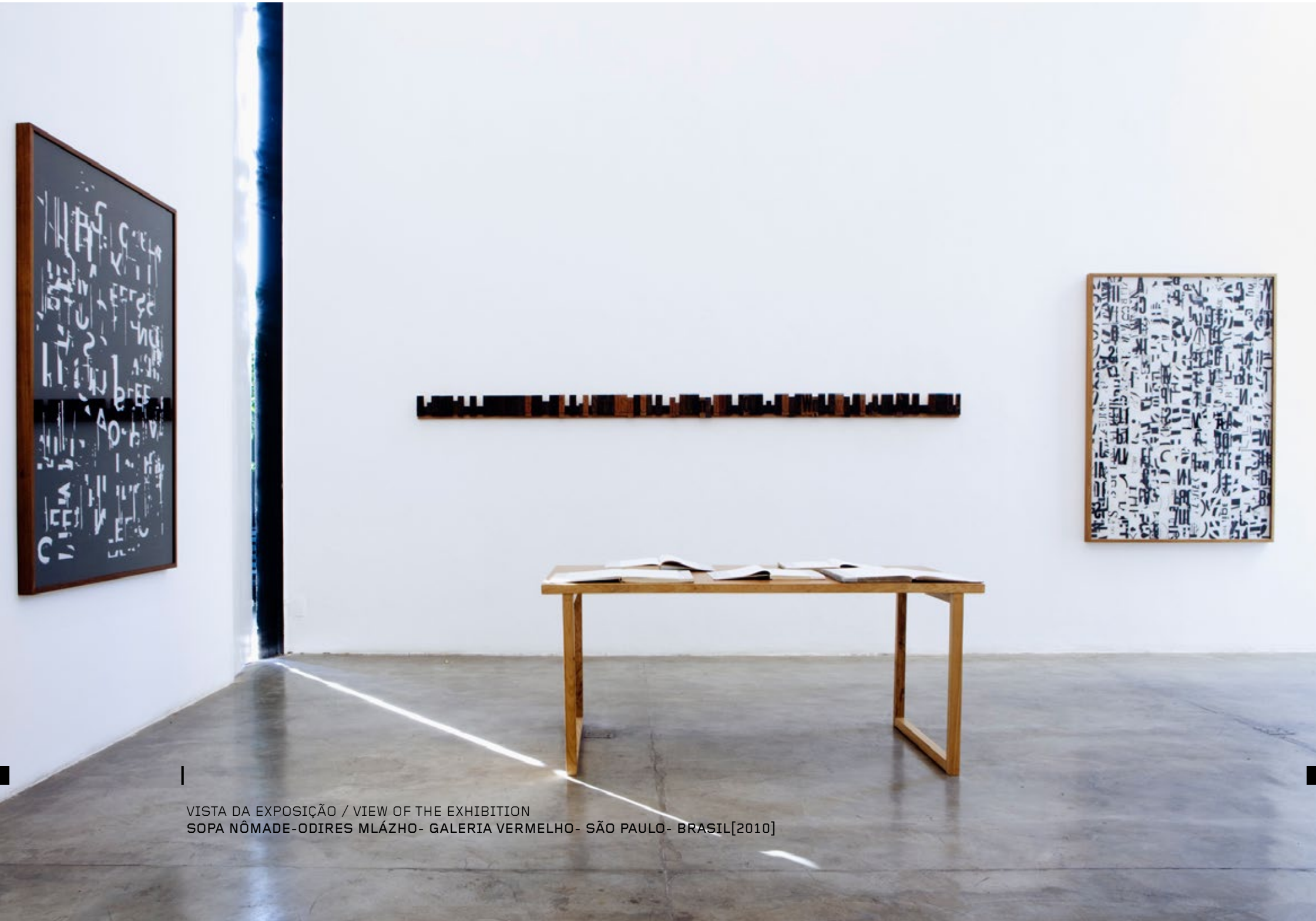
VISTA DA EXPOSIÇÃO / VIEW OF THE EXHIBITION SOPA NÔMADE-ODIRES MLÁZHO- GALERIA VERMELHO- SÃO PAULO- BRASIL[2010]