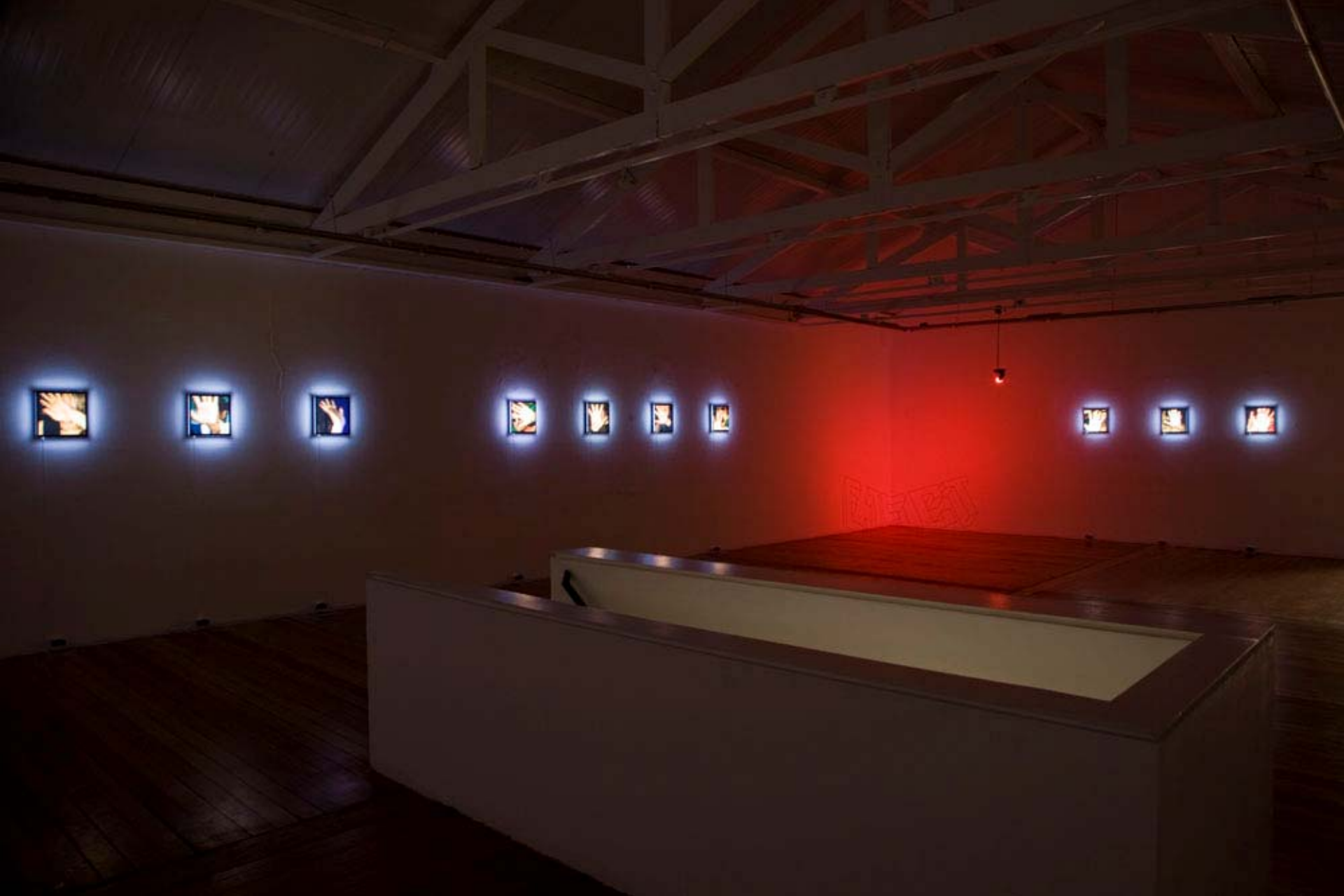
Vista parcial da exposição Sob Controle / Partial view of the exhibition Under Control