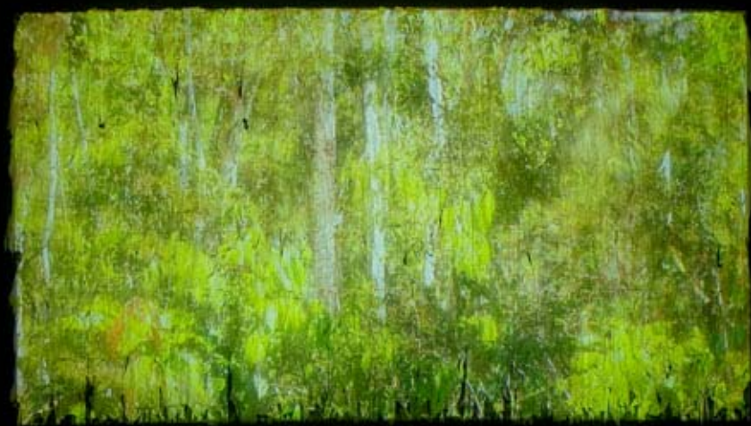
Amoahiki – vista da instalação / Amoahiki – view of the instalation.