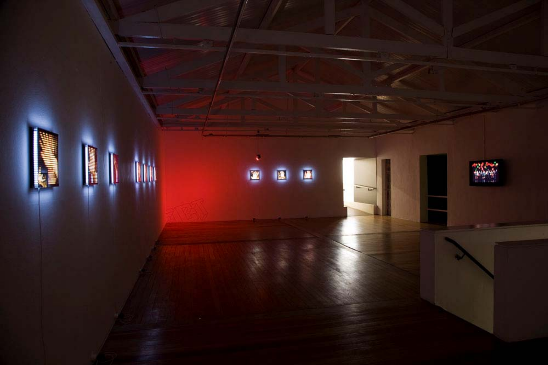
Vista parcial da exposição Sob Controle / Partial view of the exhibition Under Control