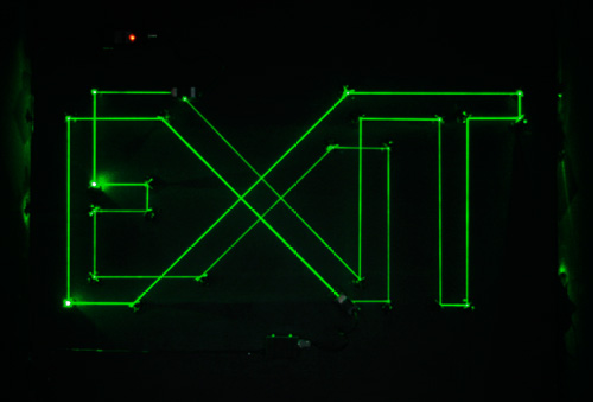
Exit – vista da instalação / Exit – view of the installation