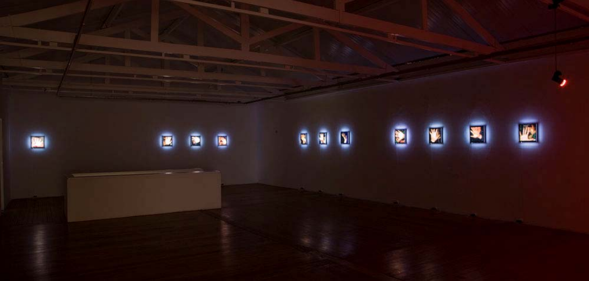
Vista parcial da exposição Sob Controle / Partial view of the exhibition Under Control