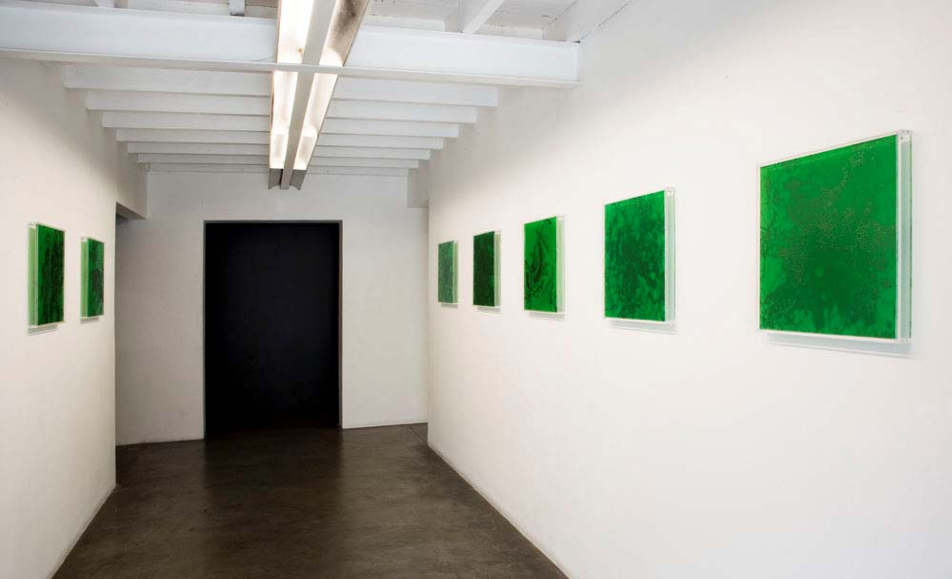
Sob Controle – vista do hall de entrada, Galeria Vermelho / Under Control – view of the entrance hall, Galeria Vermelho.