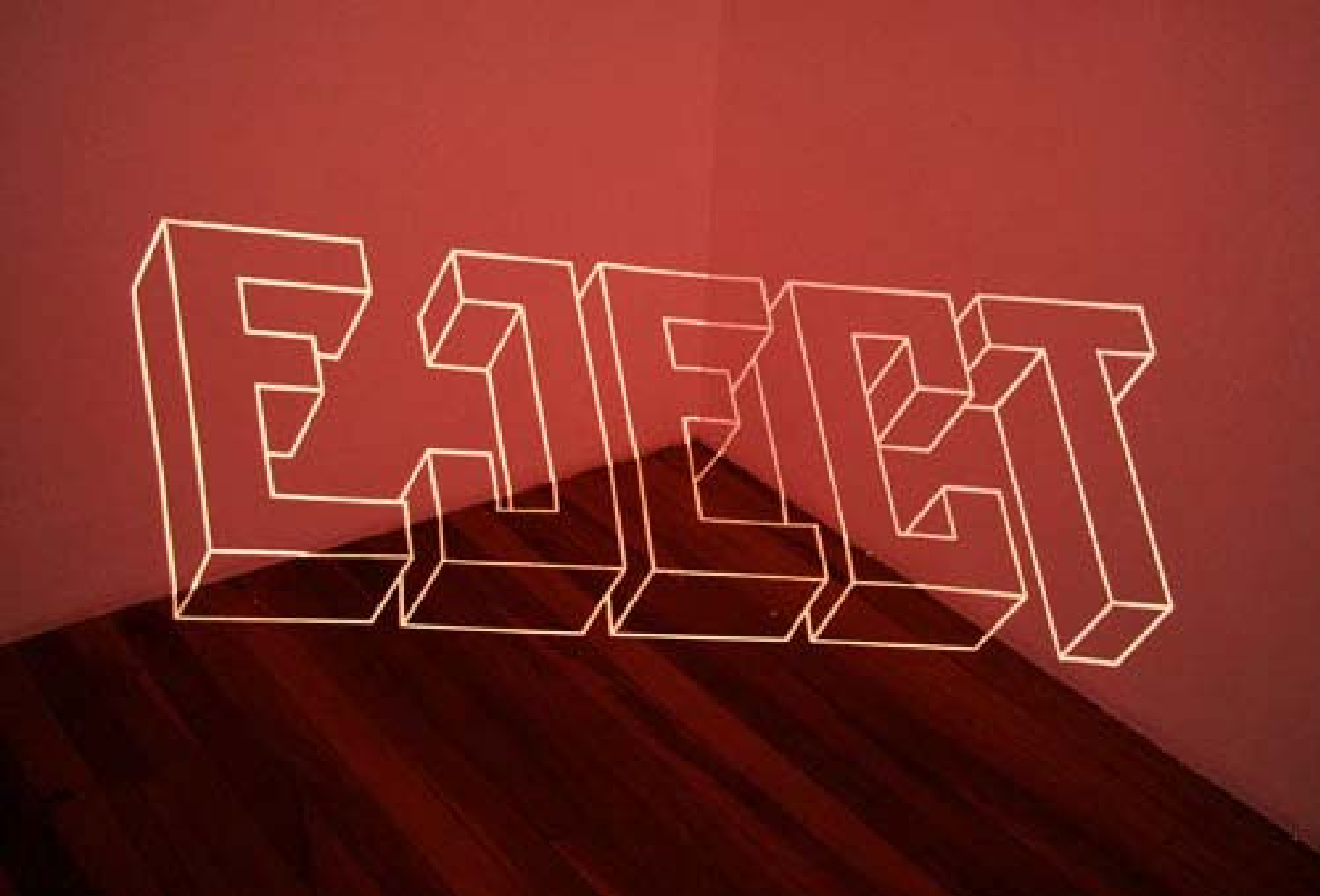
EJECT, 2008 Instalação / installation