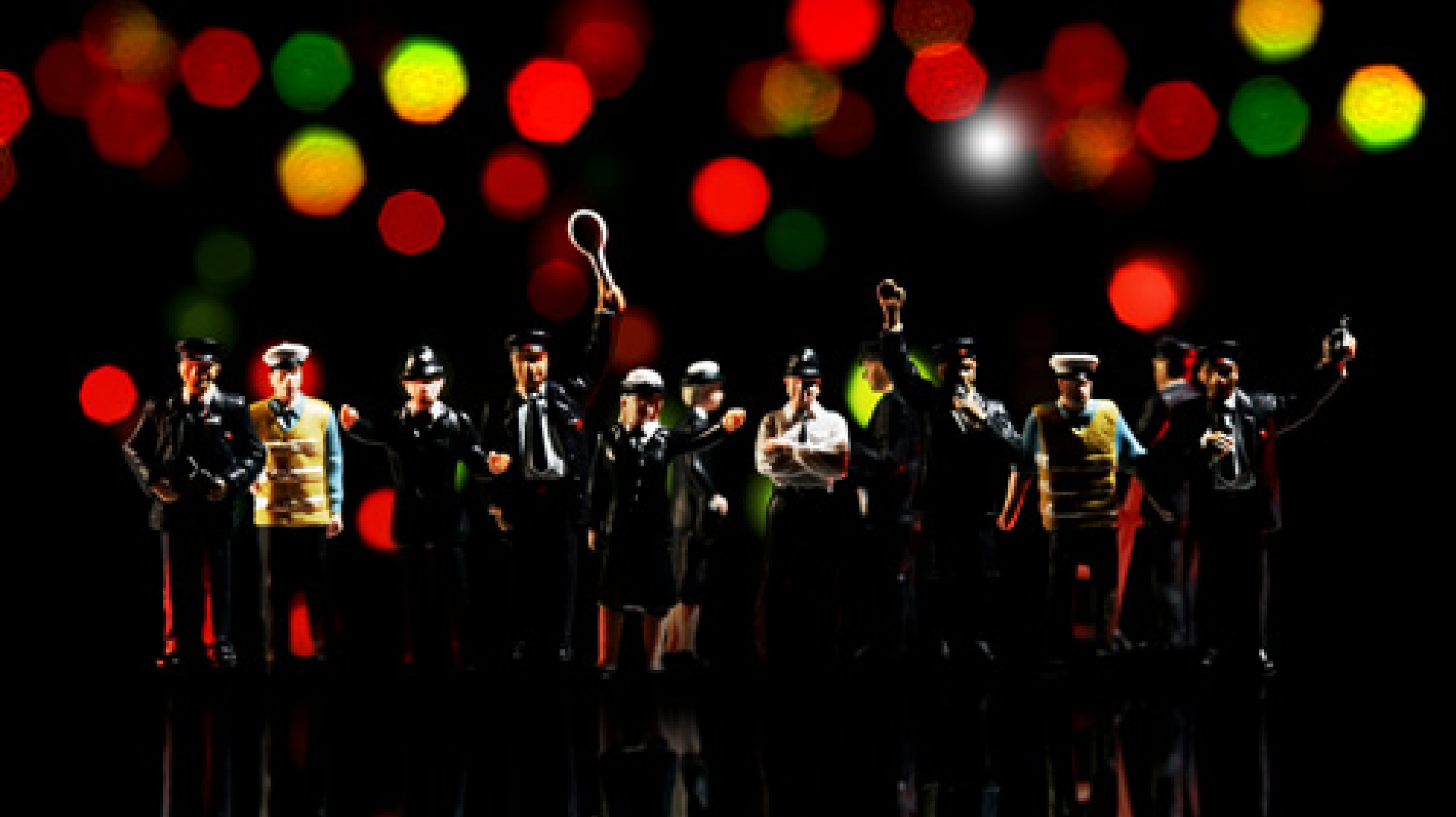
SOB CONTROLE / Under Control , 2009 Vídeo instalação / video installation