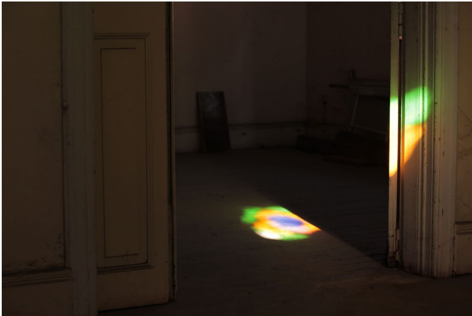
Ao sol do novo mundo 2016 - 2017 155' vídeo. som e cor [video, color and sound]